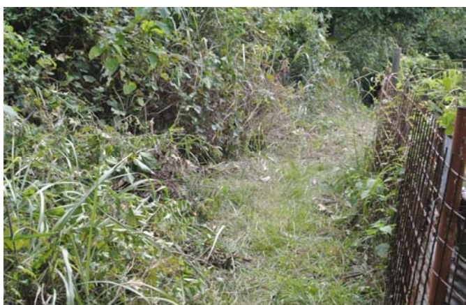
幅員の狭いところは拡げた