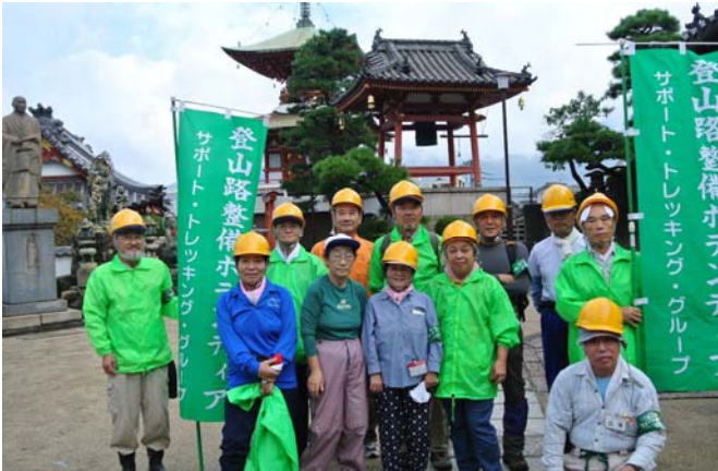
駐車場を借りている万年寺にて