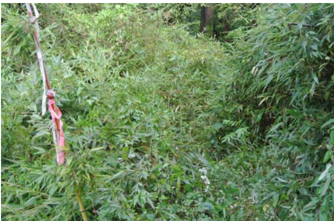
草木に覆われて路面の見えない登山路