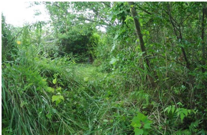
草に覆われて見えなくなった登山路