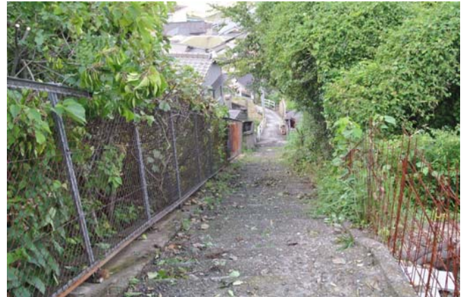
人家から直接続く登山路