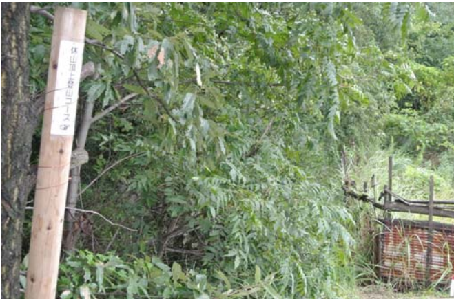
枝木で見えなくなった登山路