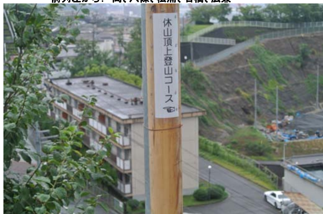
手製の道標を宮原1丁目の車道に設置