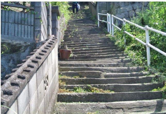
休山ルート宮原2丁目からの登山口 9/3