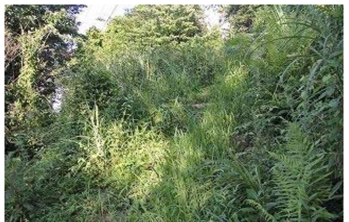
灰ヶ峰道路から正面登山路あまりの草、ひどいので三人で草刈り 8/1