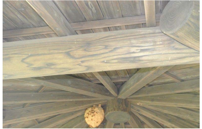
灰ヶ峰9合目展望台の天井にスズメ蜂の巣 8/4