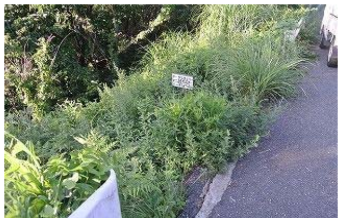
灰ヶ峰山頂草刈前 正面・尾根ルートの下り口 8/7