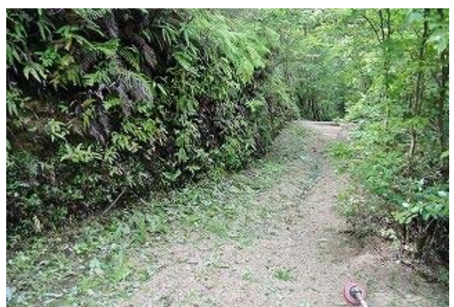
中国自然歩道 大庭山 シダを刈払機で刈る 8/10