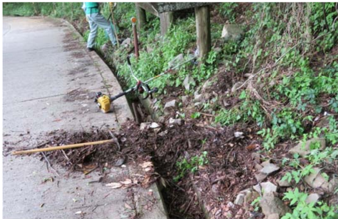
第3展望台の前 詰まった側溝 (猪が詰まらせた?)