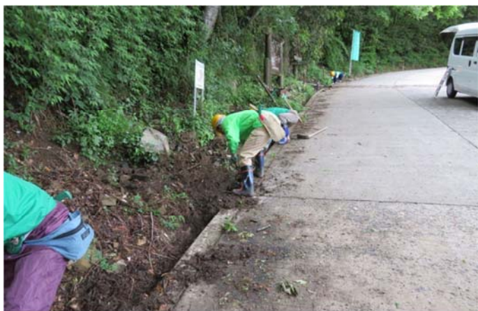
チョットだけと始めた側溝の清掃 大仕事だった