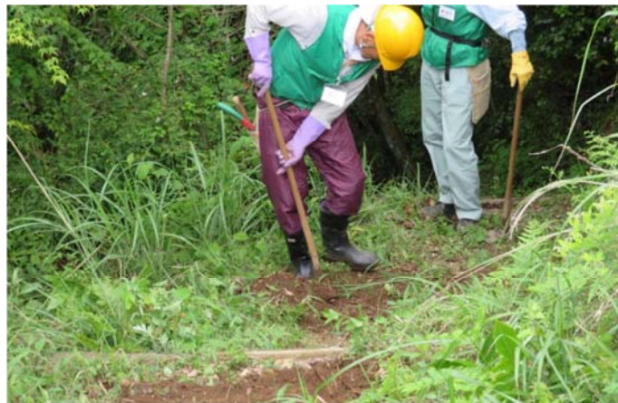
鍬を使って整備中