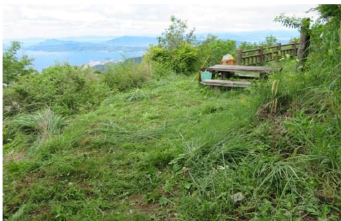
八合目の展望台 草刈後 呉湾が素敵に見えた