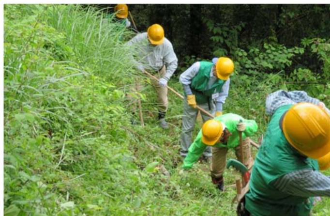
中国自然歩道 整備中