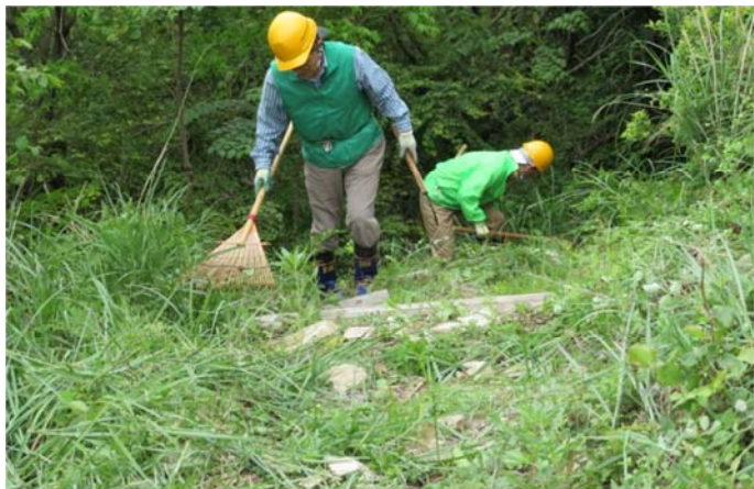
中国自然歩道 整備中 カマヤ熊手