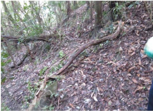
手入れ前の登山口