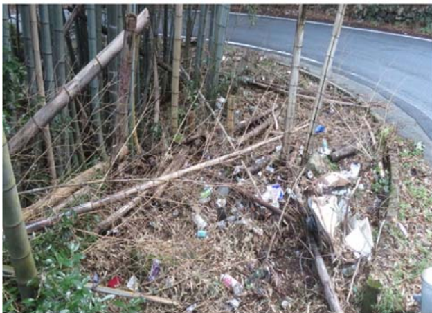
清掃前のカーブのゴミ