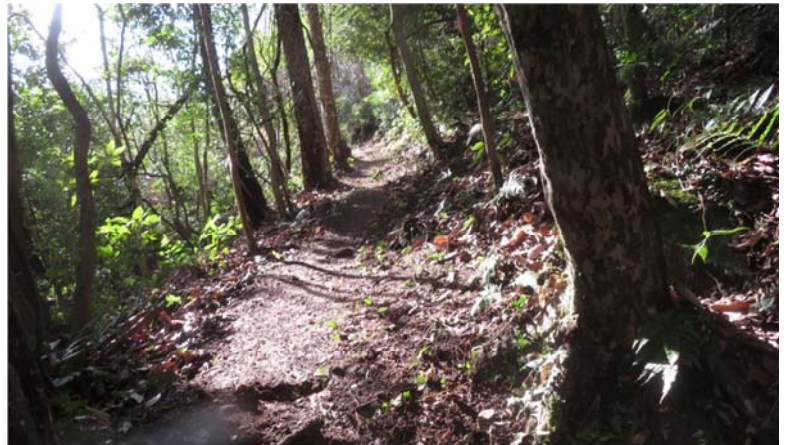
ブローアを使って落ち葉を撤去後の登山路