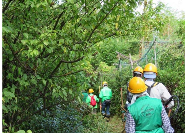
路を広げにくい登山路