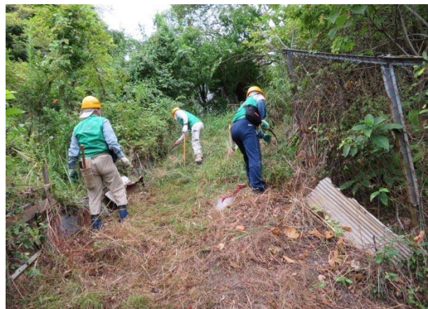
それぞれで草刈り中