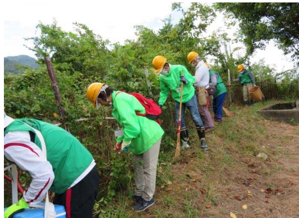
策を超える枝木の切り取り中