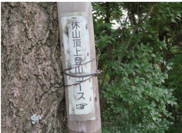
何年前かの手製の道標