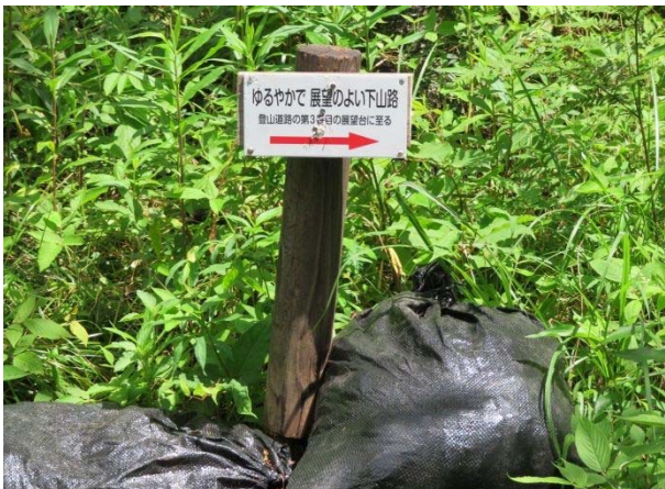
灰ヶ峰 (737m) 正面登山路中腹 道標の付け直し 草が生えないように土嚢を設置