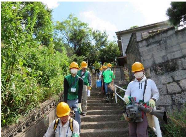
作業終了直前の参加者