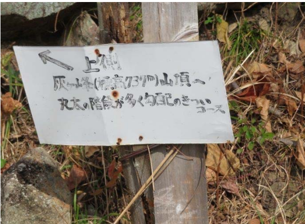
うん十年前 自家製道標 支柱が腐った