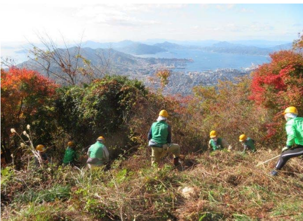
視界を広げるために木を切る前