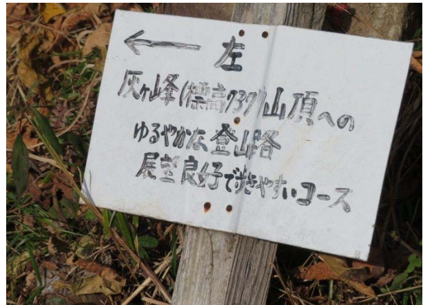
ウン十年前の道標 腐って倒れた