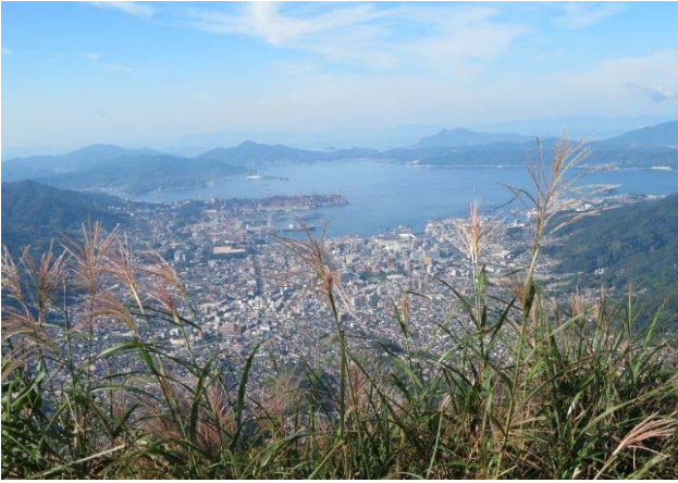
8合目 展望台から奥湾を望む