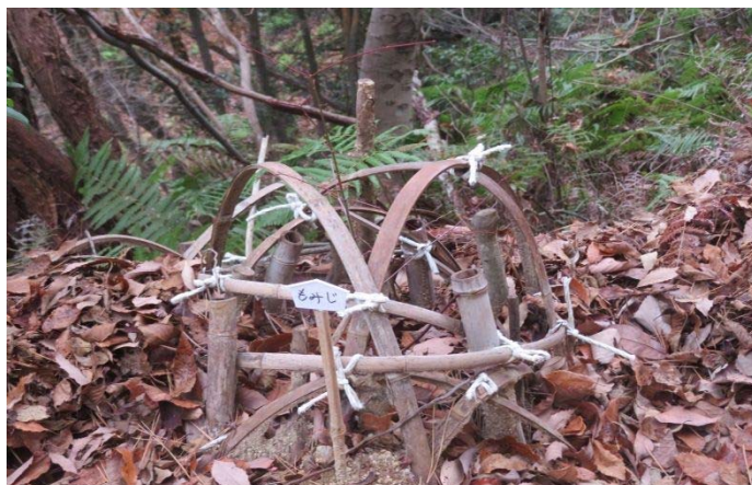
大庭山 植林 地元の永宗氏紅葉を植える