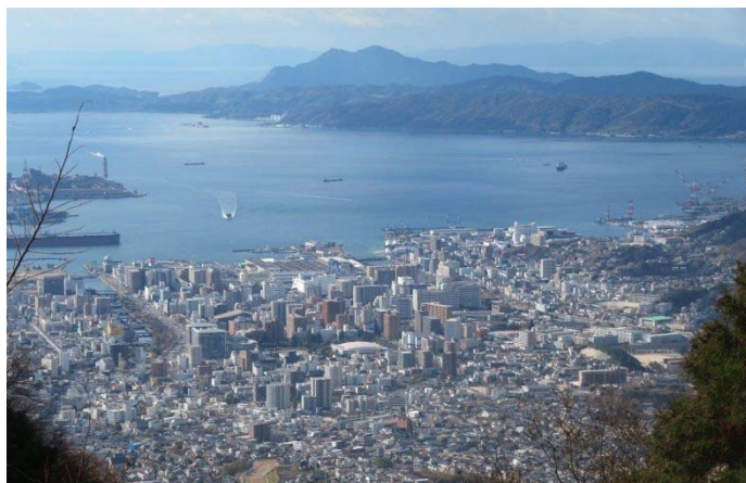
七曲りコースから呉湾を望む