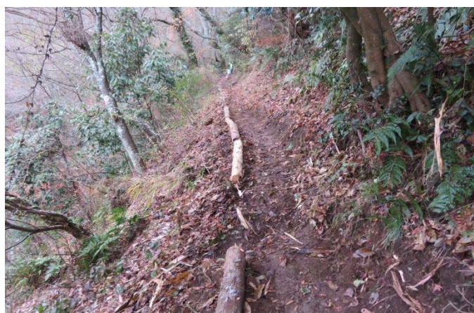
古木を使って路肩の補強