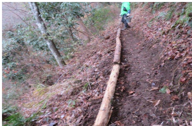
国有林の古木を使って路肩を補強後