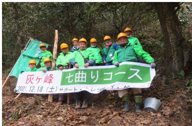
金明水の入り口にて整列