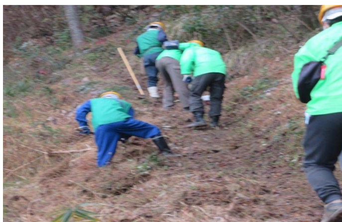
登山路整備中 七曲りコース