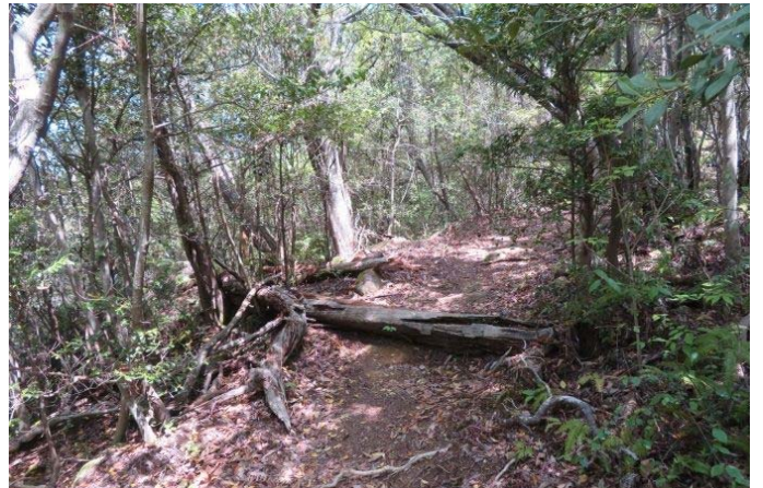
吉浦からの鳴滝からの登山路の倒木