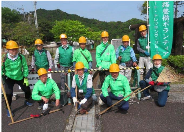
呉市野外活動センター駐車場にて