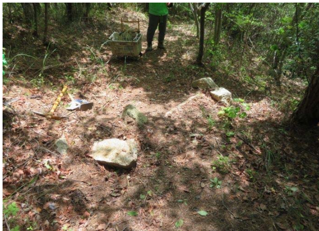
風雨で潰れてしまった横断溝