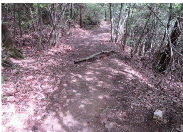
フロア出落ち葉をきれいに飛ばした登山路