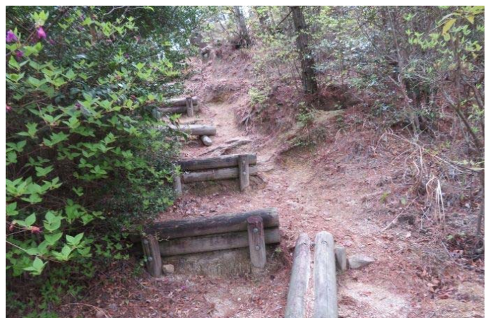
勾配がきつく流れかけてしまった登山路・手入れ前