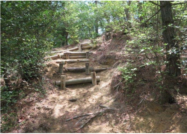
階段 2 本の丸太を 1 本に・階段の数を増加した