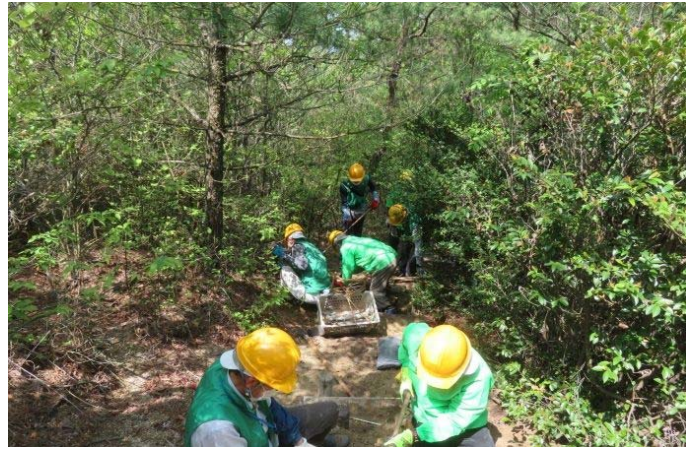
階段の補修に骨を折っている所