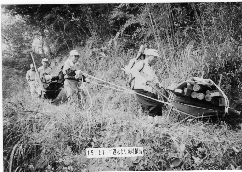
15. 11 二艘木より廃材搬出