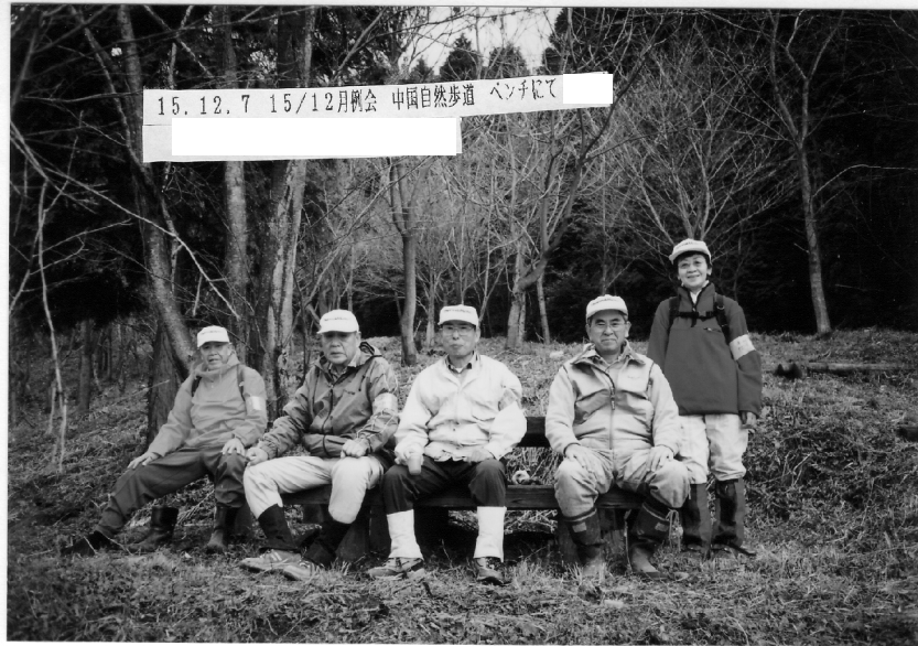
15. 12. 7 15/12月例会 中国自然歩道 ベンチにて