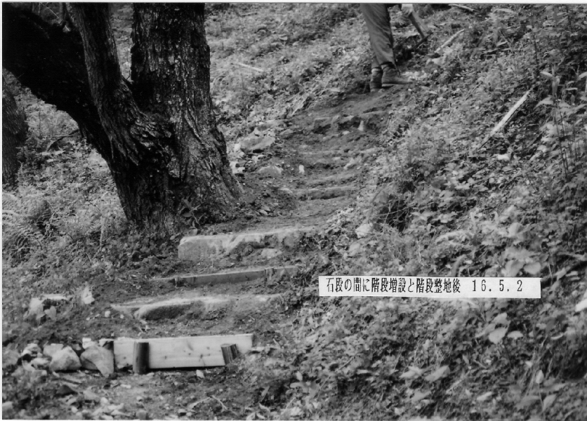
石段の間に階段増設と階段整地後 16.5.2