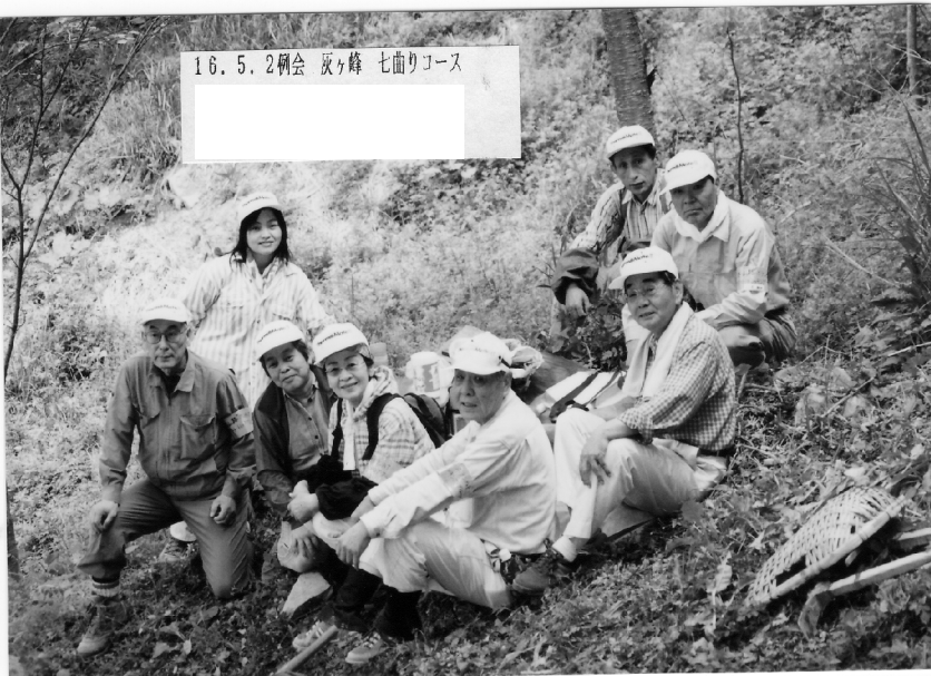
16.5.2例会 灰ヶ峰 七曲りコース