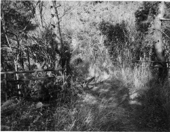
隧道上の公園 手入れ前