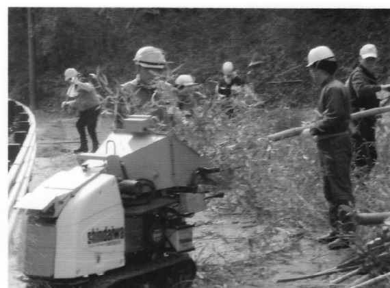
チップパーマシンで竹を粉碎中