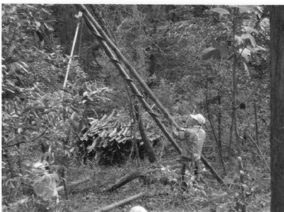
4mの鋸で巻きつけた藁を切断中