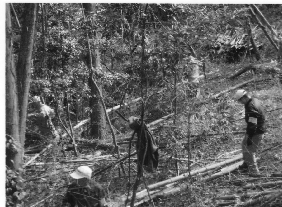
道路上では伐採した竹をチップパーマシンで粉碎中