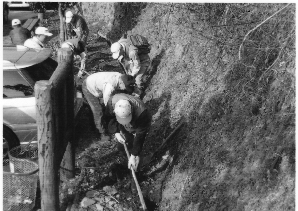
土砂の掘り出し作業中