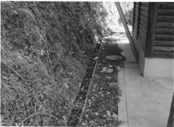
路傍休憩所裏 半ば埋まった側溝