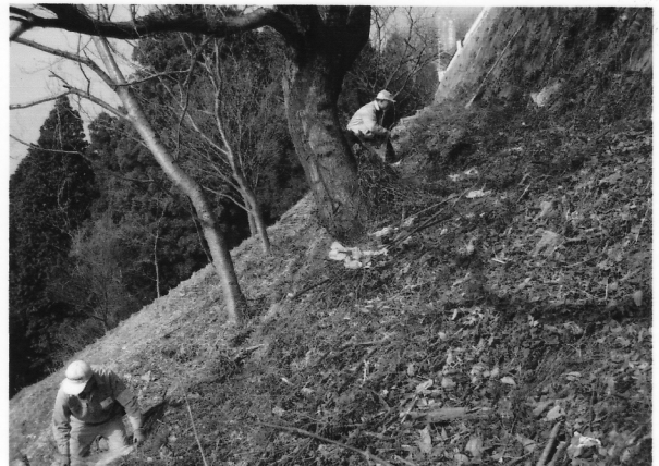
路傍休憩所前 道路下斜面のごみを回収中