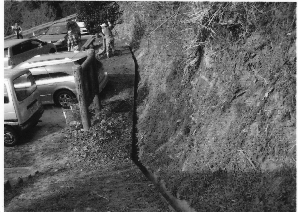
土砂を階段のくぼ地へ運び出して、側溝を復活させる(作業後)