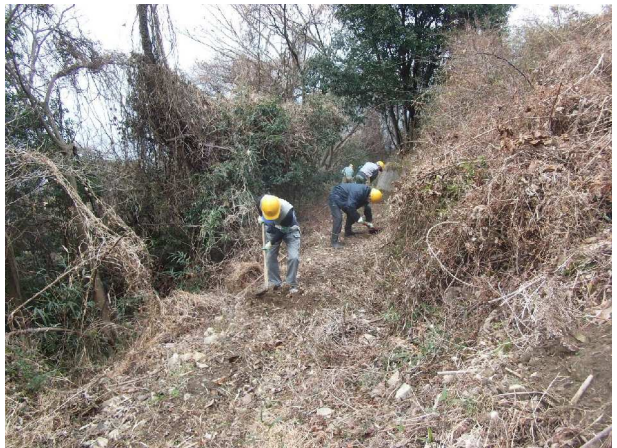
猪が荒らした路を補修整備中