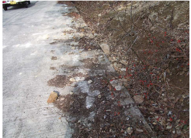
山側の斜面が崩れて土砂が道路に散乱