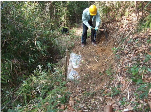
路肩が陥没、丸太、杭、土嚢で補修