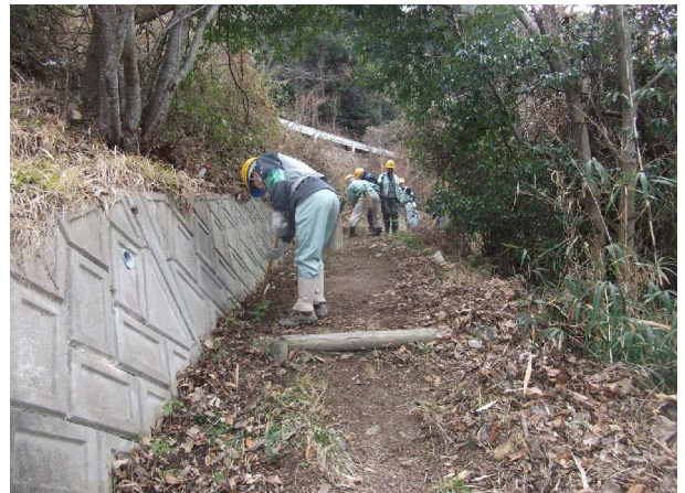
石ころを除去、整備・清掃中