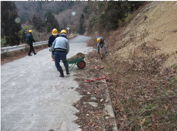
斜面が崩れて土砂が側溝を埋める