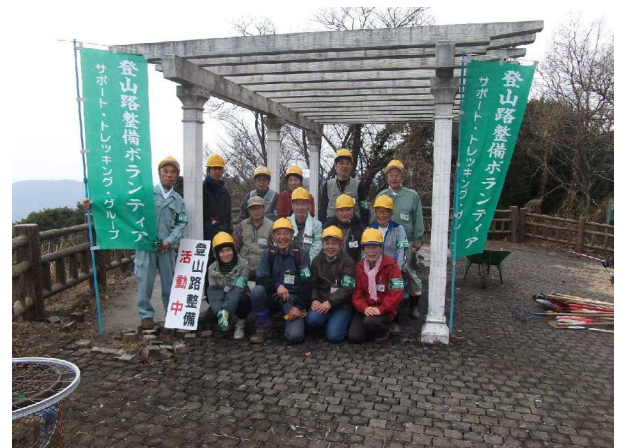
灰ヶ峰登山道路第1番目の展望台にて