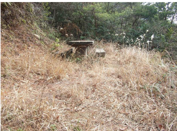
枯れ草の中のベンチ