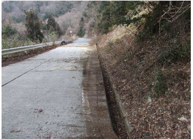
土砂を除去、清掃後