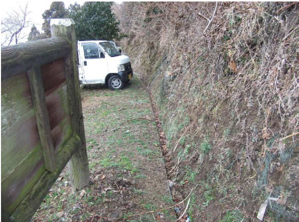
路傍休憩所背後の側溝 (清掃前)