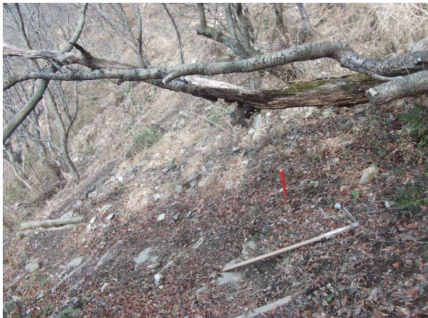
枯れて倒れた桜の木