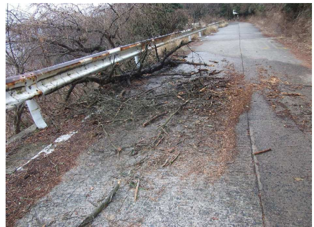
登山道路に倒れた枯れ木(切断・撤去前)