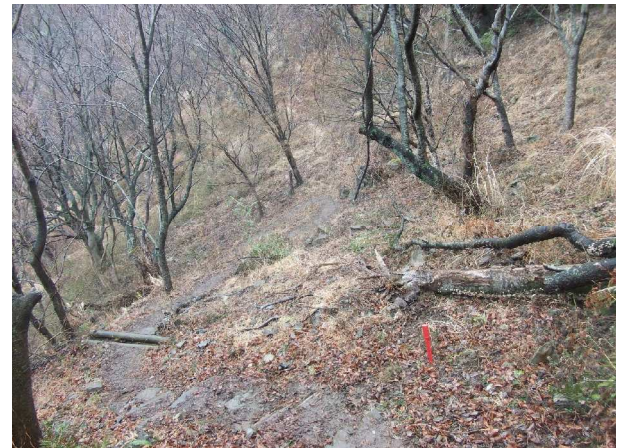
枯れた枝木を伐採した後の桜