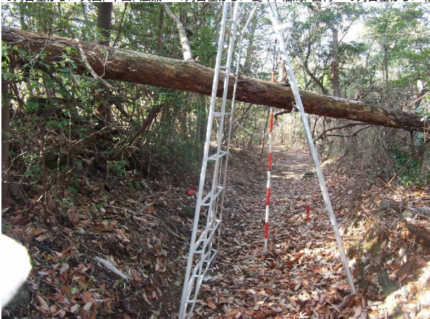
登山路の上に倒れた巨木(切断・撤去前)