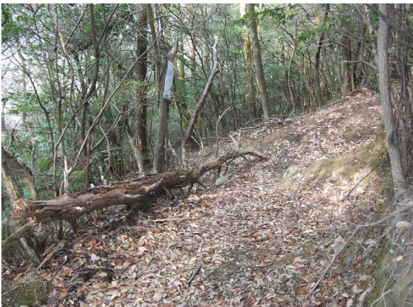
登山路を塞ぐ枯れ木