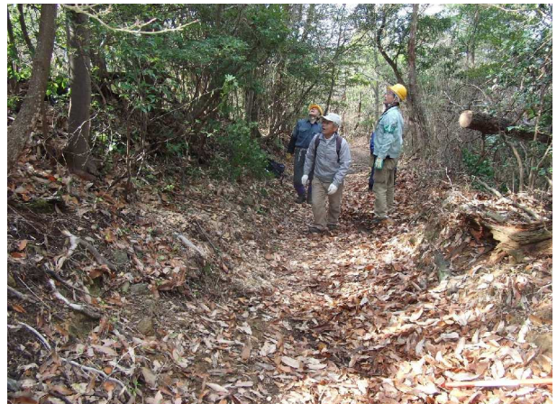
登山路の上に倒れた巨木(切断後)