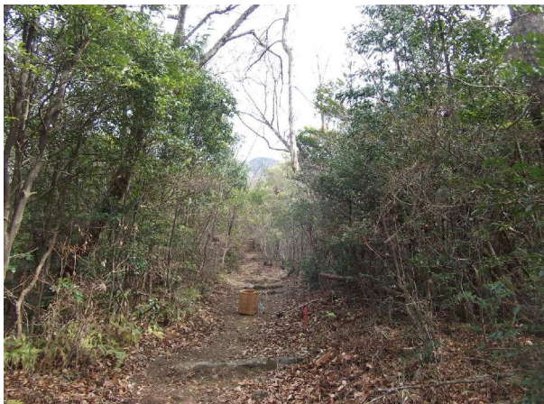
頭上に垂れ下った枯れ木(撤去前)