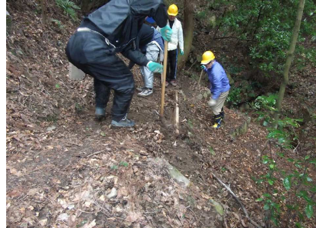
路肩に補強材を取付け中