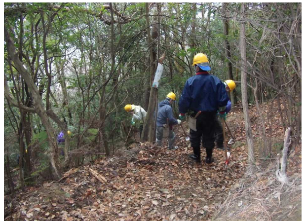
枯れ木切断・撤去後の登山路