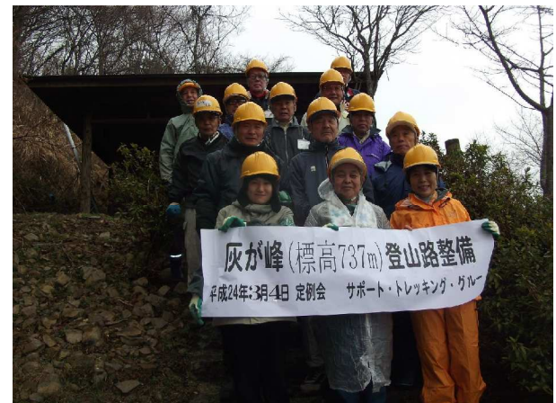
路傍休憩所の石段にて

灰ヶ峰(標高737m)登山路整備 平成24年3月4日 定例会 サポート・トレッキンググループ