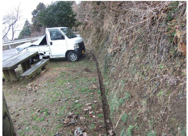
路傍休憩所背後の側溝 (整備・清掃後)