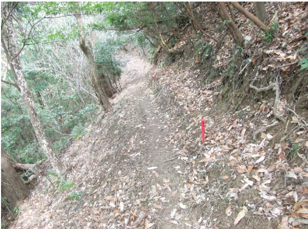
法面が崩れて狭くなった路