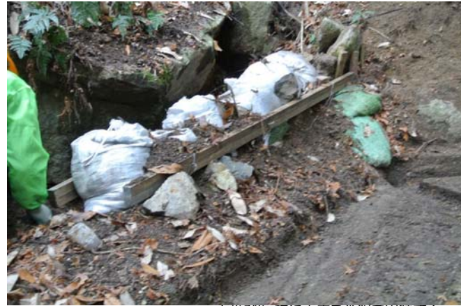
土嚢7個、杭に垂木を番線で固縛する