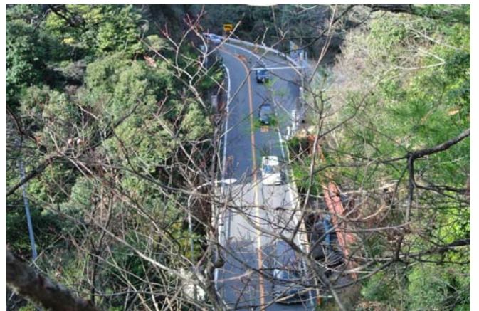
二河峡公園より県道を望む