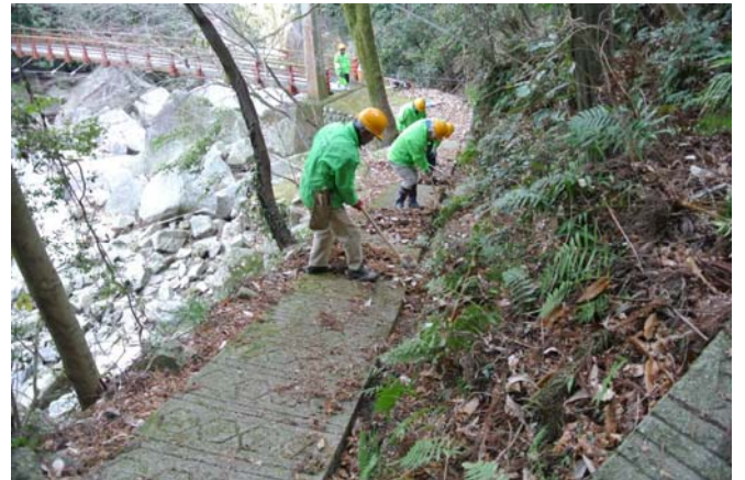
吊り橋近辺を清掃中