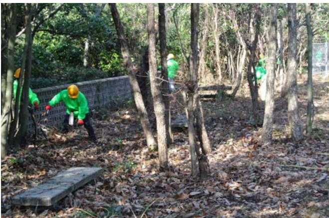
県道(市内～焼山)遂道上の公園清掃中