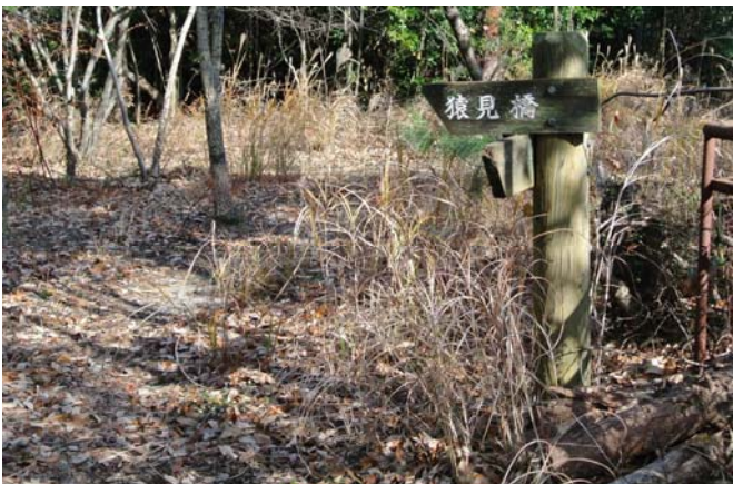
隧道上の公園 草刈前