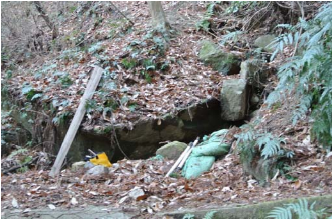
毎年補修するも水流で決壊する水路