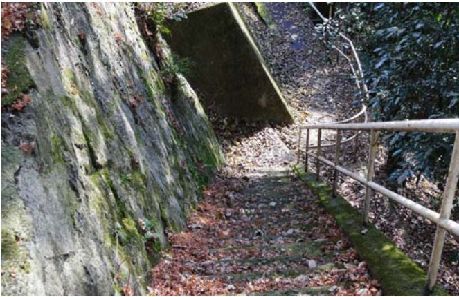
「全国水道百選」碑前 清掃前