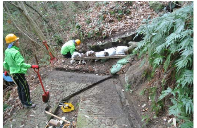
水流で決壊しないように補強