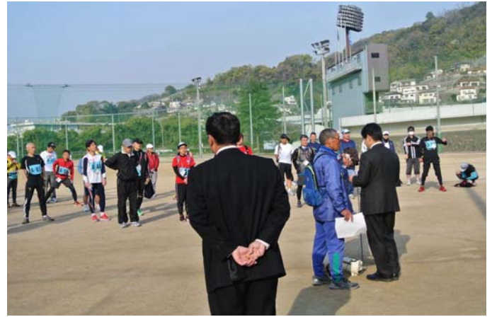
灰ヶ峰～休山 縦走大会