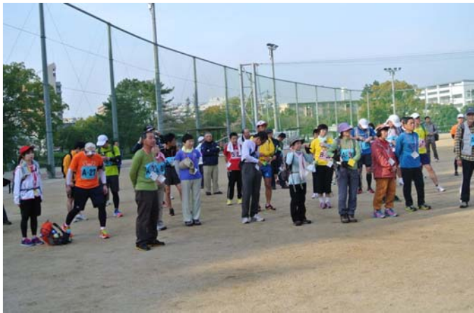
呉二河グラウンドにて開会式