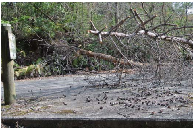
鳴滝終点駐車場の倒木