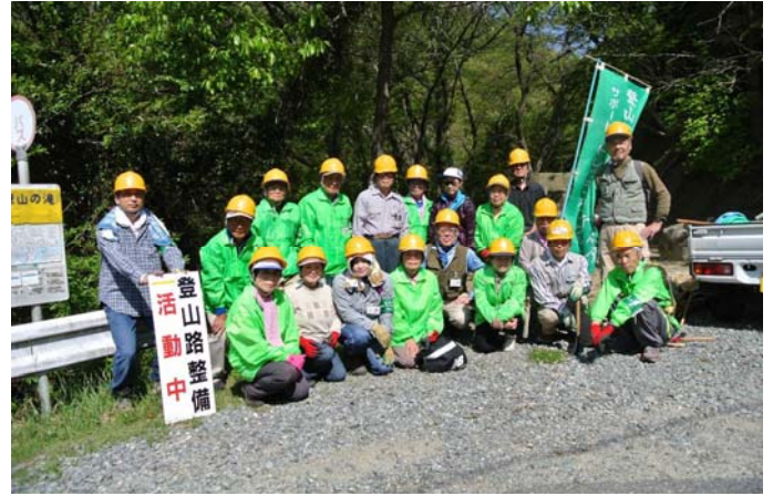
深山の滝バス停にて