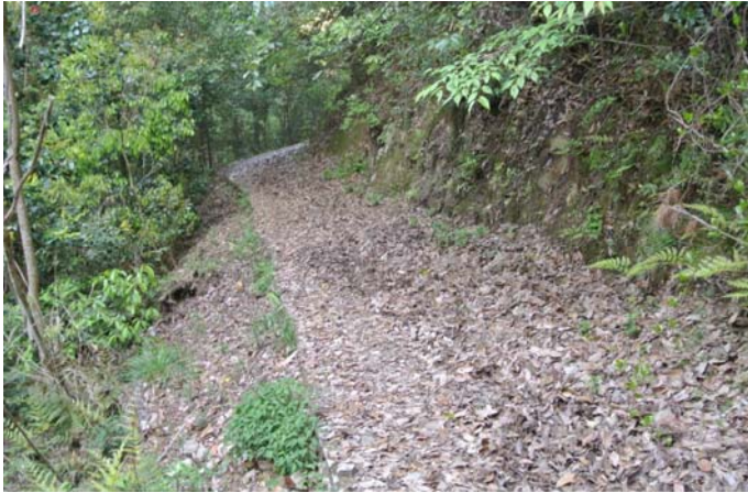
清掃前の自然歩道