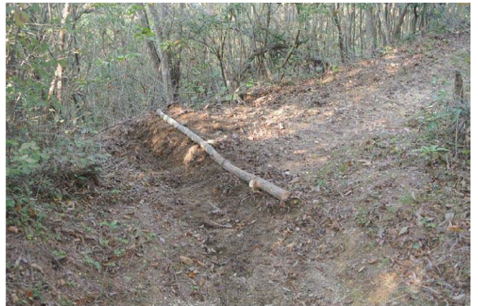
水路を丸太で新設