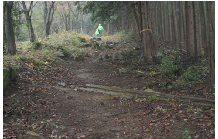
横断溝掘り下げと草刈後