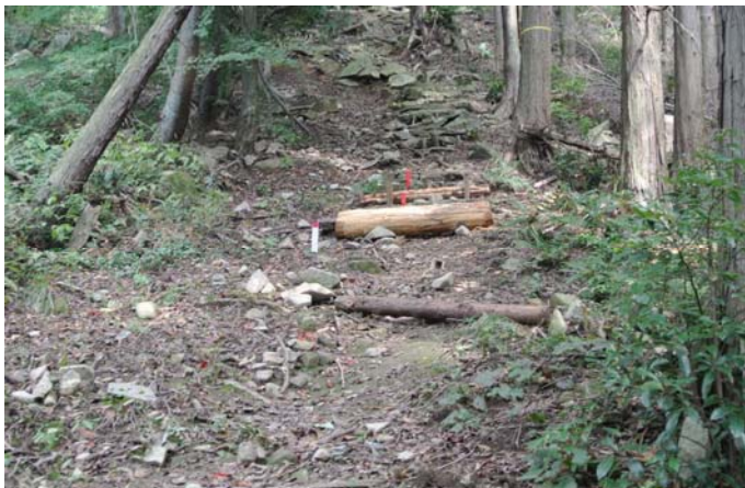
階段の増設と横断溝の新設中