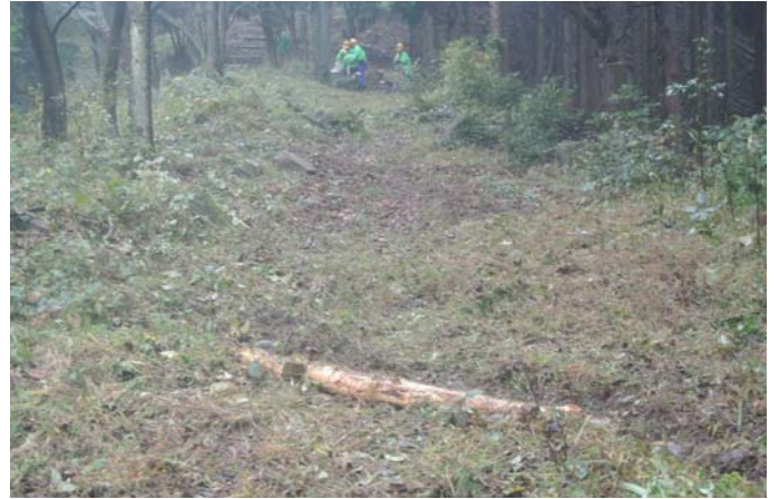
横断溝新設と草刈後