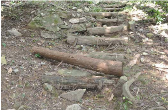
丸太取替え前の階段