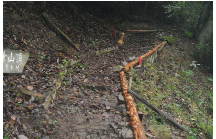
丸太で路肩を補強後