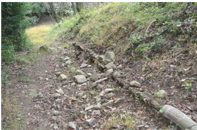
路に石ころ多し(手入前)