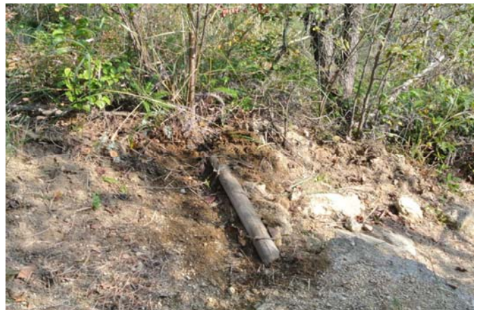
丸太を使って水路づくり