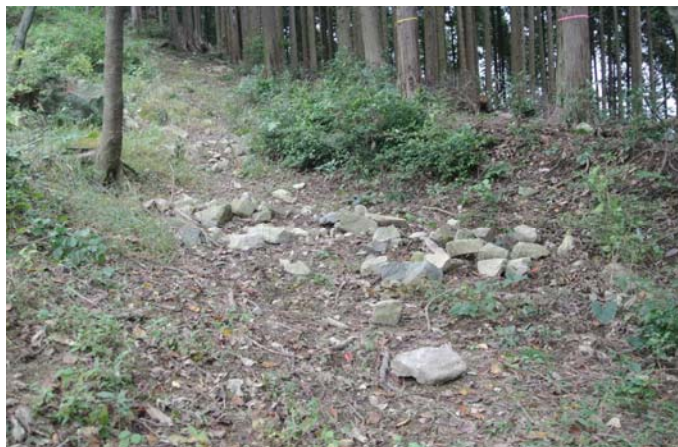
石ころが多い路(手入前)