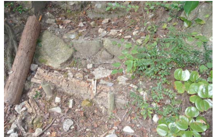
丸太が腐りかけた階段(取替え前)