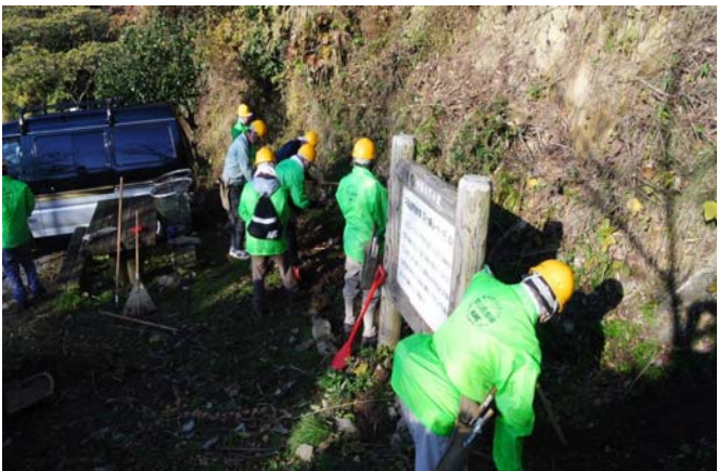
側溝を埋めた土砂はなかなか深い