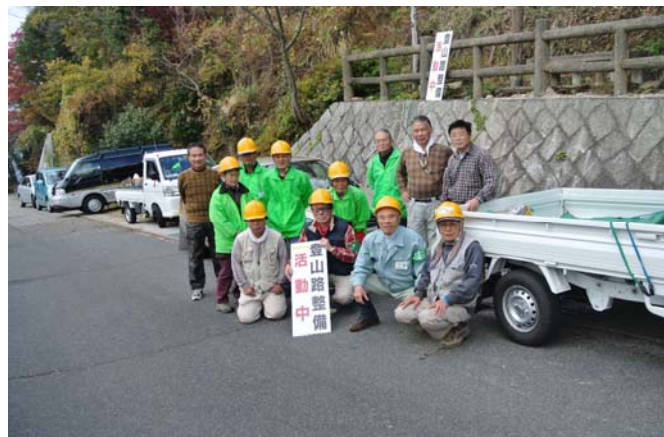
路傍展望台前にて