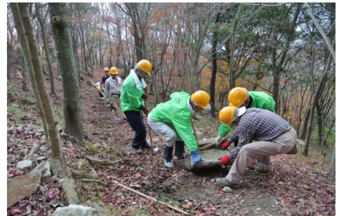
登山路の岩を移動中