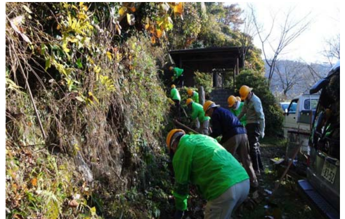
路傍の展望台、土砂に埋まった側溝を掘り起こし中