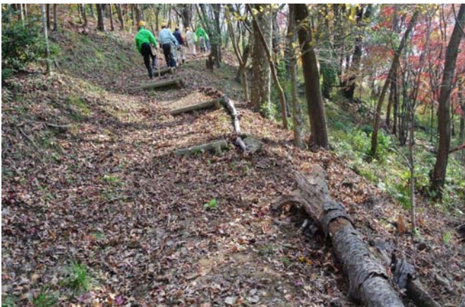
倒木を路肩補強材として利用する