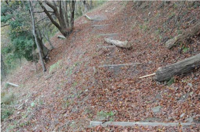
森から倒木を切断、必要箇所へ運ぶ