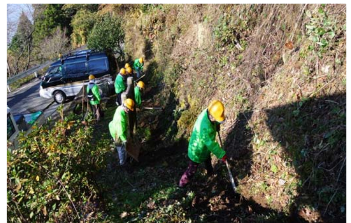
側溝が土砂で深く埋まっていた