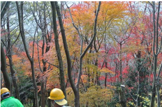
紅葉が疲れを癒してくれる