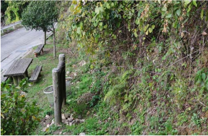
手入前の路傍展望台