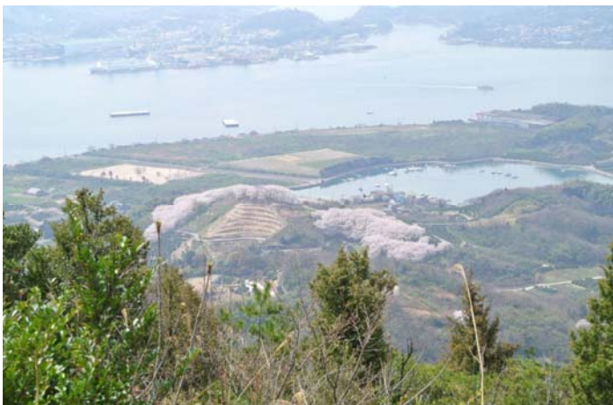
4月3日 さぎ島(三原市)「塔の峰千本桜」