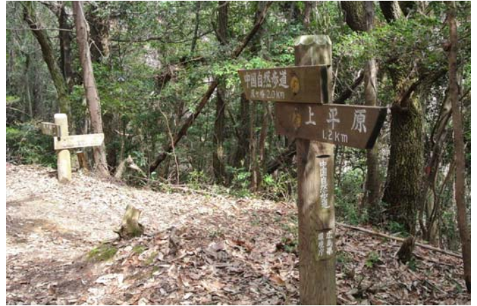
道標の向きを直す