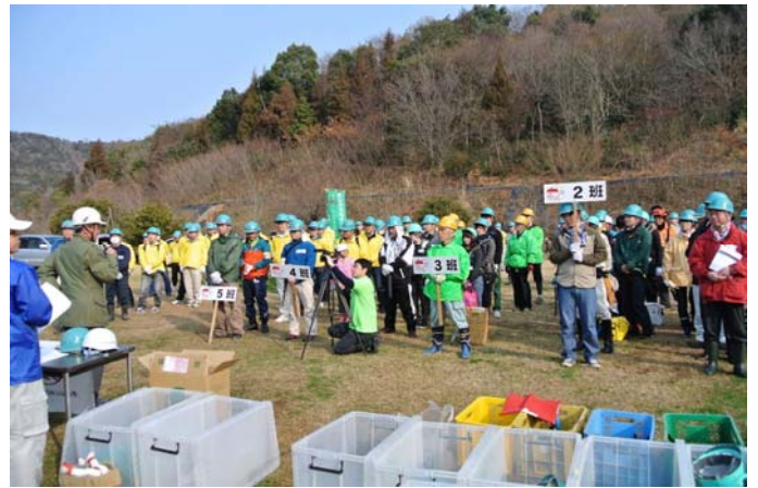
3月9日 「山のグランドワーク」開会式