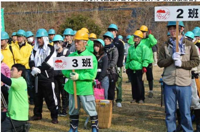
3月9日 西条「山のグランドワーク」に参加した当会会員