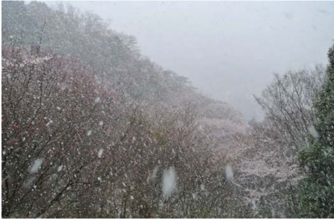
突然の降雹(こうひょう)のため作業取りやめ