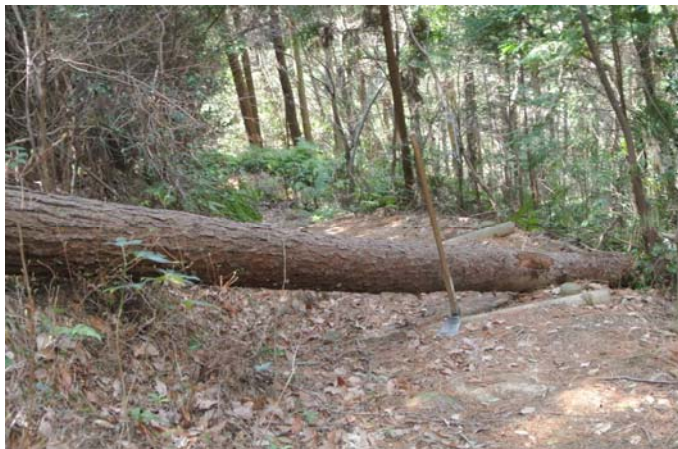
灰ヶ峰近道登山路を塞いでいる松枯れの大木