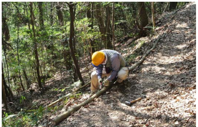
路肩補強として廃材丸太を杭に番線で固縛中