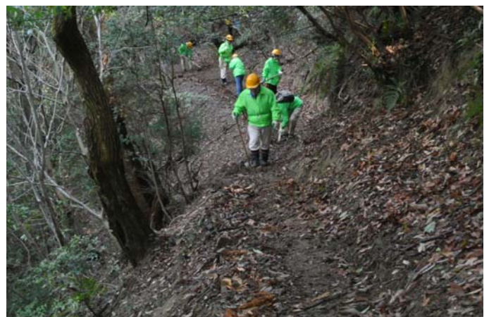
「銀明水の上」を整備中