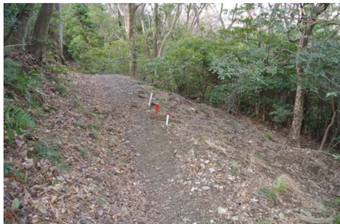
3月11日 路肩補強のための廃材設置箇所杭打ち