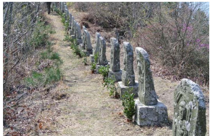
4月3日 大平山の南側にある「33観音」