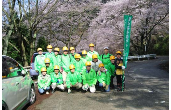
4月6日 満開の桜をバックに集合写真 (中国自然歩道「灰ヶ峰」)