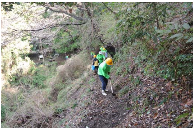
「七曲手前」を整備中