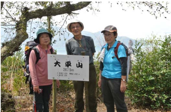
4月3日 低い山ではあるが、登るのがきつい「大平山」に登山