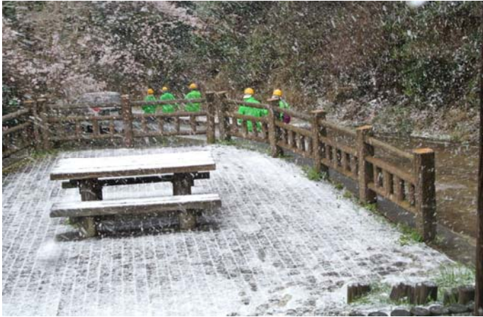
4月6日 桜満開というのに時ならぬ「あられ」の襲来 あられで路面が白くなった灰ヶ峰「第3番展望台」