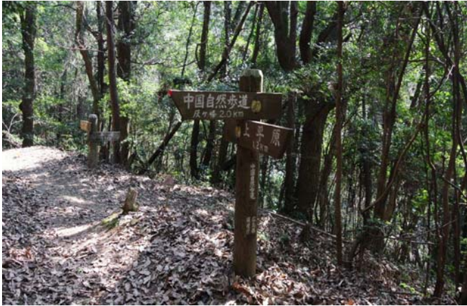
何かがあったか誰かのいたずらか道標の向きが違っている