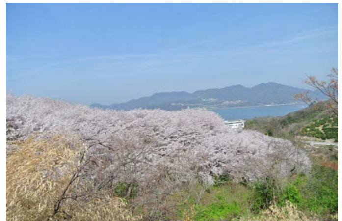
4月3日 見事に咲いた「塔の峰千本桜」