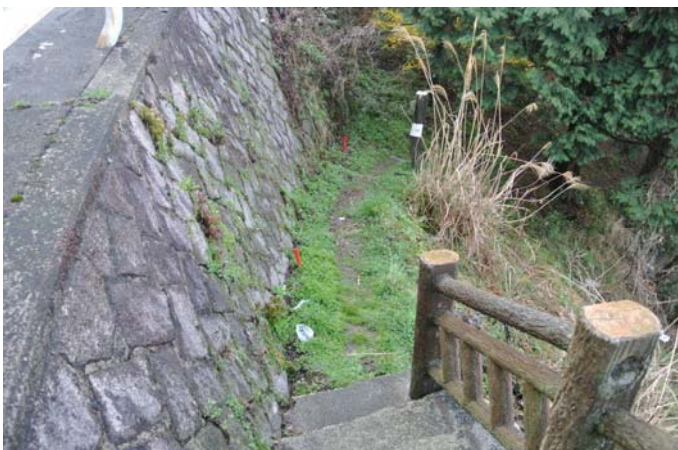
(第3展望台下) 手入前