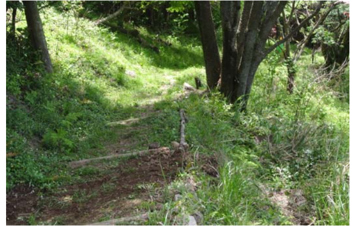
補修後の路肩補強