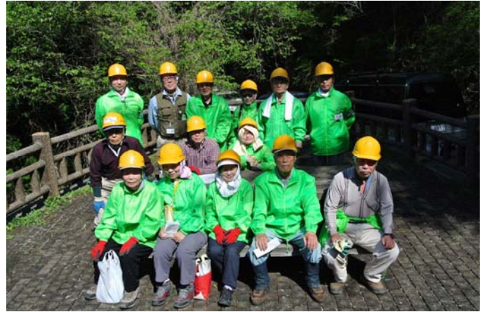
頂上道路第3番目展望台にて