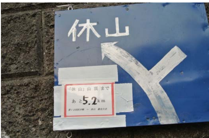
ランナーにコースと距離を知らせる案内板を設置する