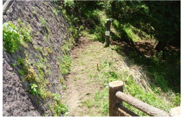
刈払い機で「葎」を刈り取った後