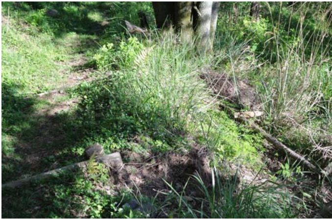
猪に掻き崩されて落下した路肩補強