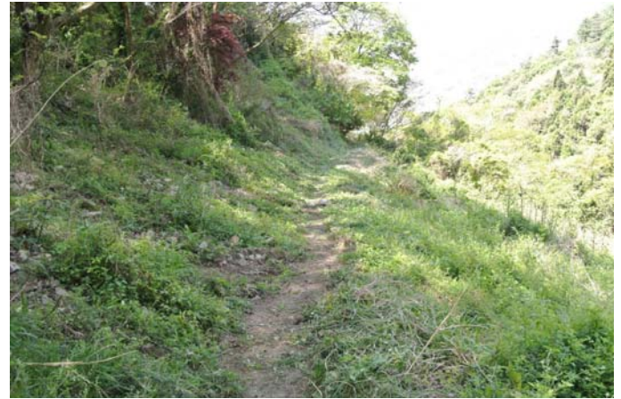
刈払い機で草刈後