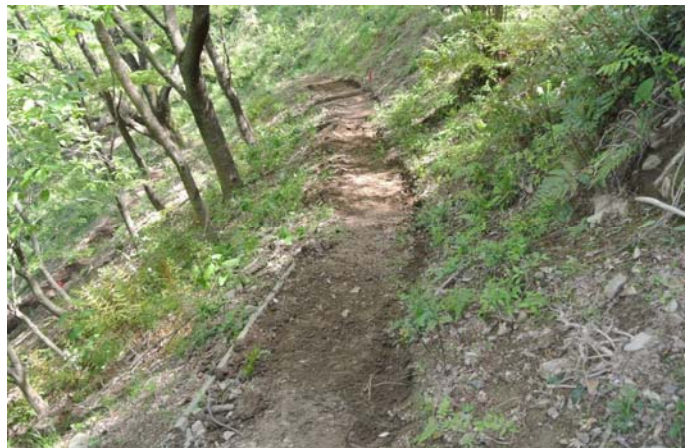
路肩の補修と水路の確保