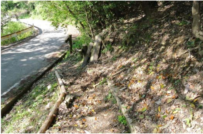
猪が荒らした斜面