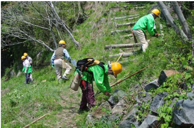
急な階段下を草刈中