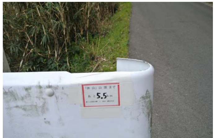
大会参加者に距離を知らせるシートを貼り付ける