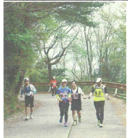
息を切らしながら上り坂を進む参加者

26.8.27 灰ヶ峰・休山爽快ラン 呉で大会 2コースに213人 7(遊)と休山(497)を流した。 一河公園多目的グラウンド(二河町)から音戸の瀬戸公園(警固屋)まで、二つの山を通る25キロ、休山だけ 小学生から70代までの 縦走大会(実行委員会主催)が20日あった。 縦走大会(実行委員会主催)が20日あった。 縦走大会(実行委員会主催)が20日あった。 縦走大会(実行委員会主催)が20日あった。