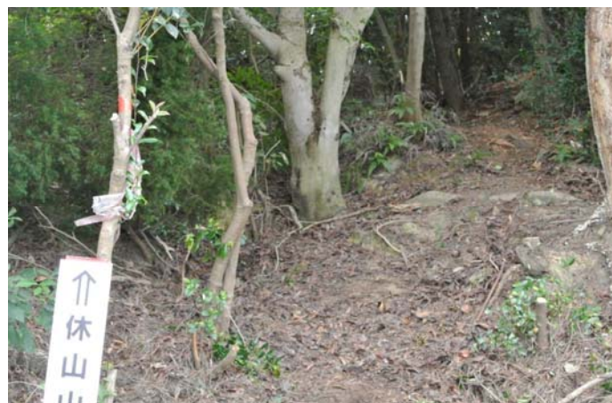
整備後明るくなった登山路