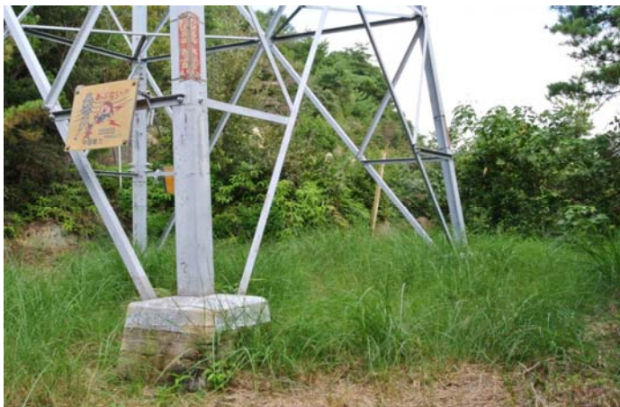
3合目送電線鉄塔付近(草刈、手入れ前)