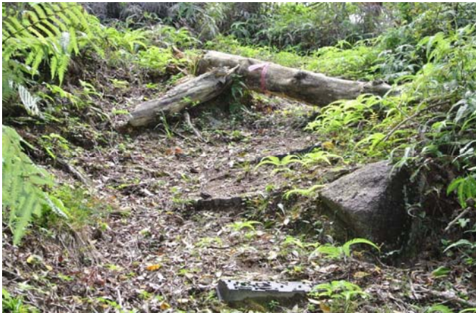
枯れて倒れた大木が路を塞ぐ