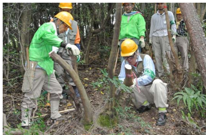
登山路をささげる木を切断中