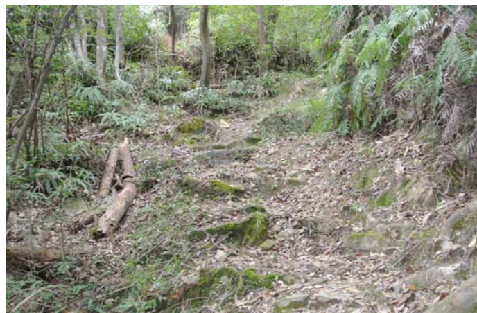
松枯を切断、登山路を確保