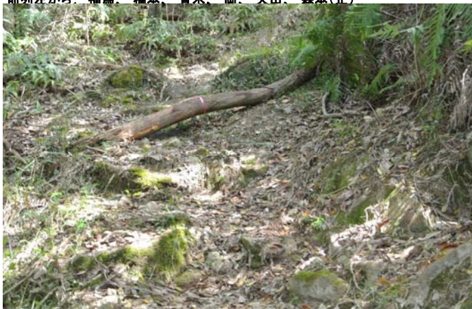
登山路を遮る松枯