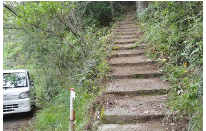
左の道標は当会の自家製 (整備後)