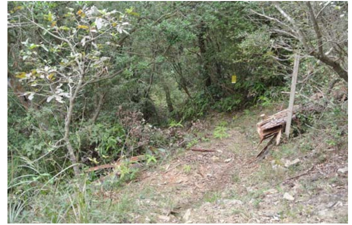
4分割に切断して撤去