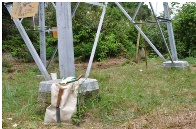
鋸きり、鎌を使って草刈、手入れをした後