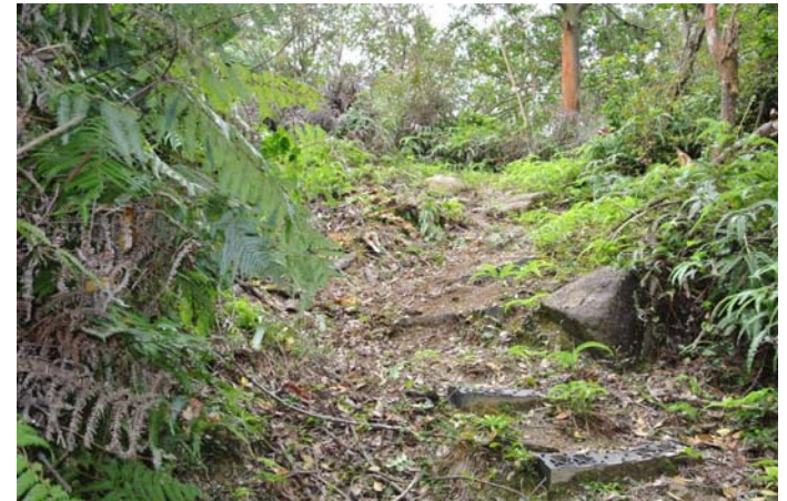
枯れ倒木を切断して撤去した後