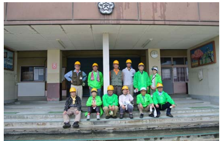
廃校になった旧大入小学校校舎前にて