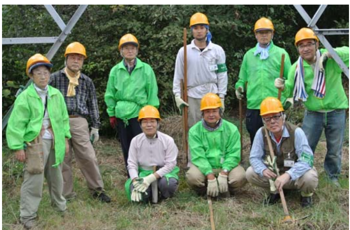
予定以上の作業をこなし、さらに張り切る面々