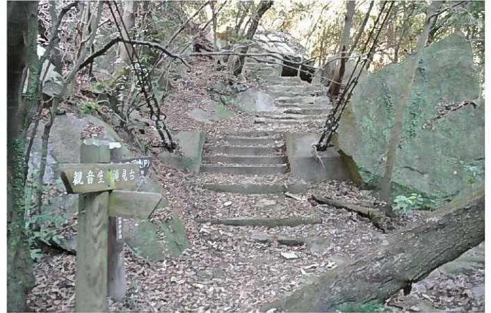
落ち葉がいっぱい