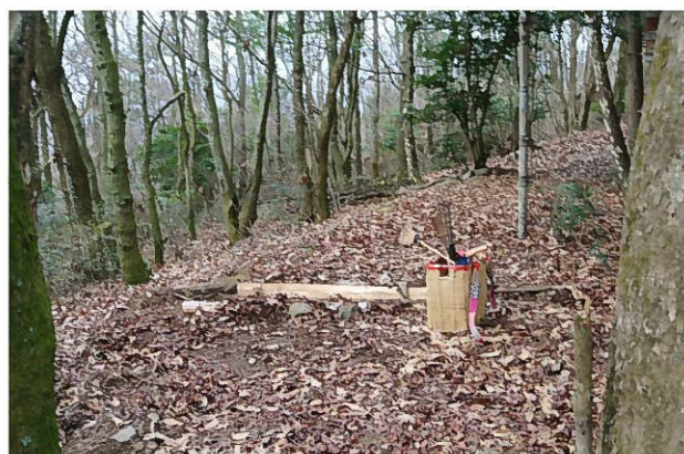
新しい丸太に取り替え