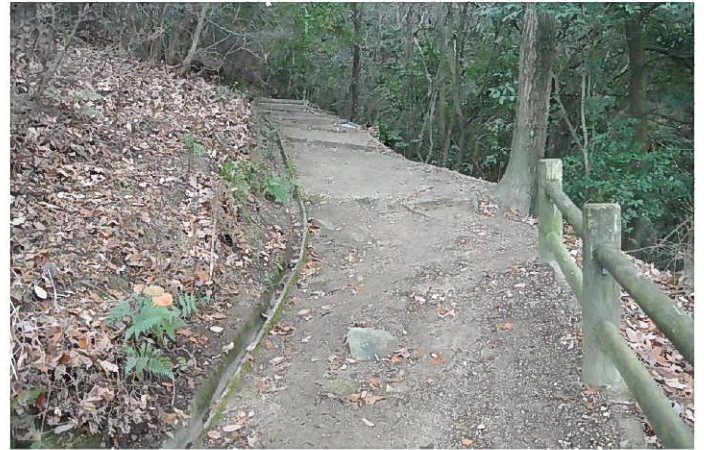
12月31日 清掃後の大庭山に続く政畝団地上の登山路