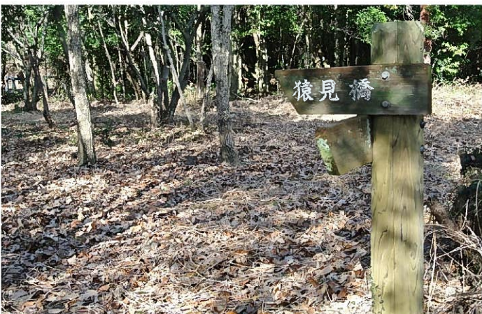
草刈り後の二河峡公園