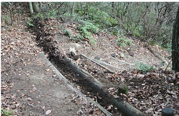
土砂と落ち葉が詰まった横断溝