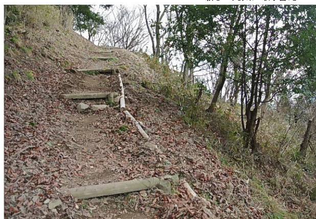
丸太を杭に固定して復元