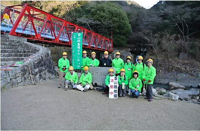
鉄管橋のたもとにて