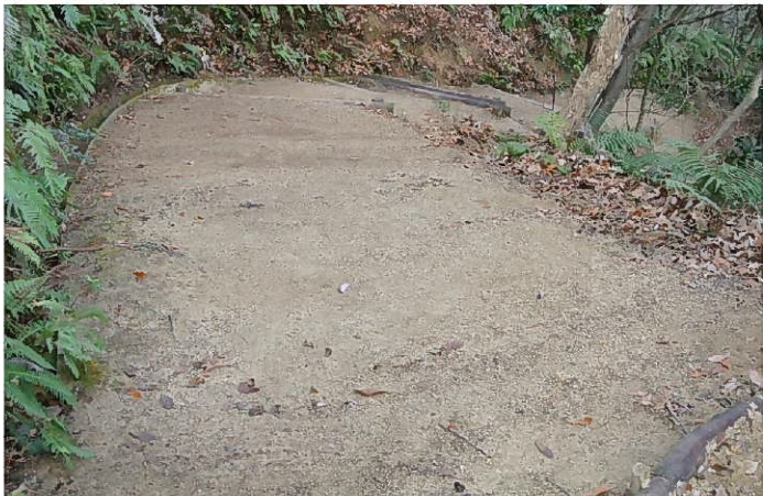
12月31日 清掃後の階段