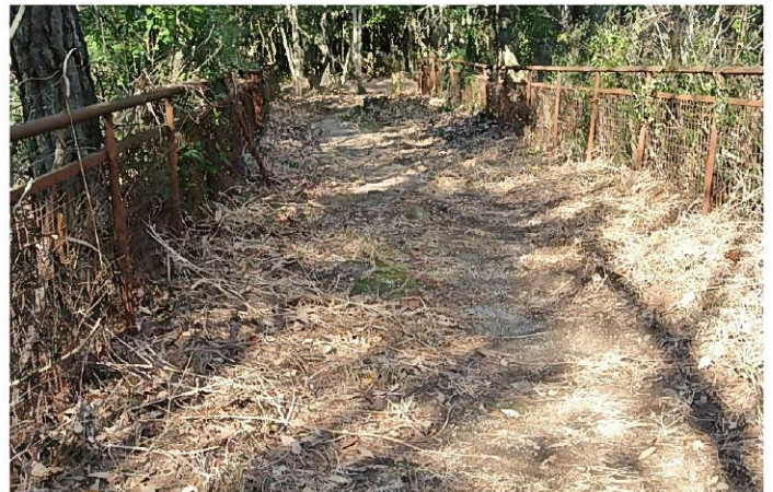
草刈り後の二河峡公園