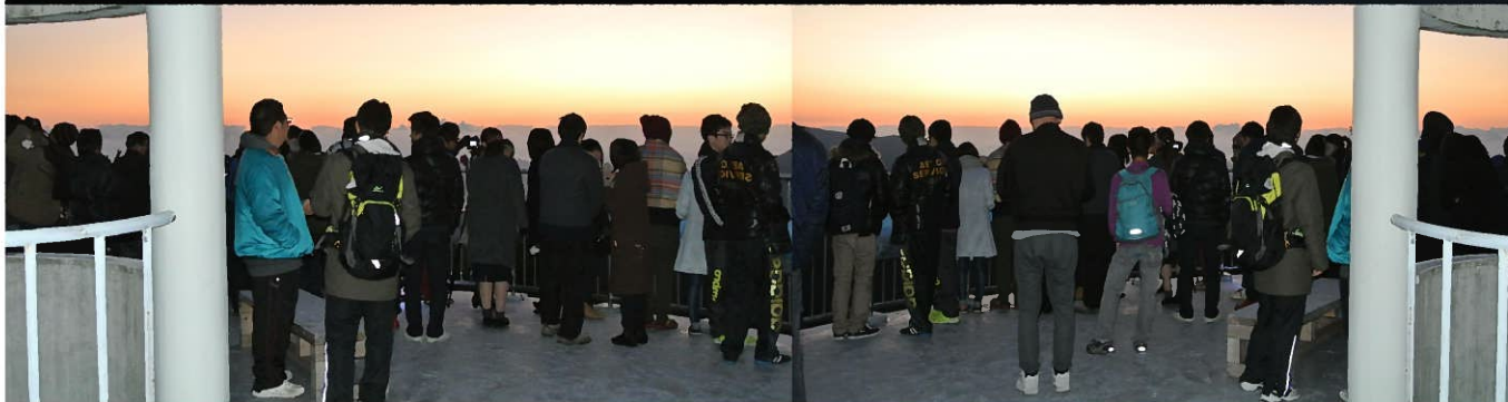
ご来光を拝む人たち