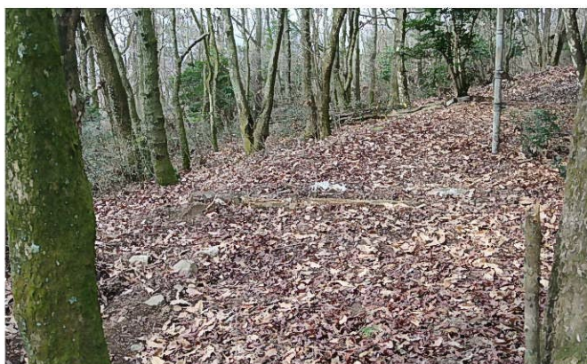
横断溝に使った丸太が腐食、用をなさない