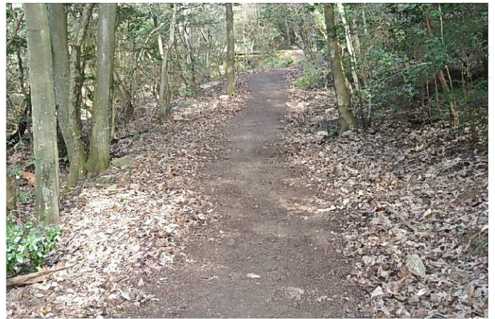
落ち葉を飛ばして見ちがえるほどきれいになった路