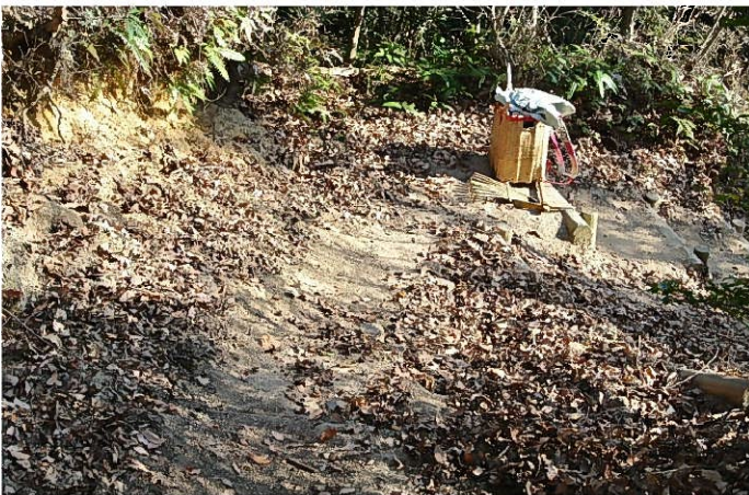
土砂に埋まった水路