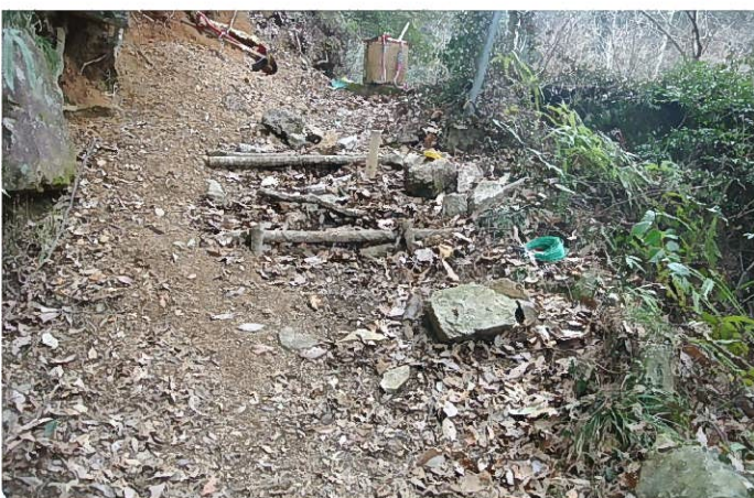
ハイカーが作った簡易階段