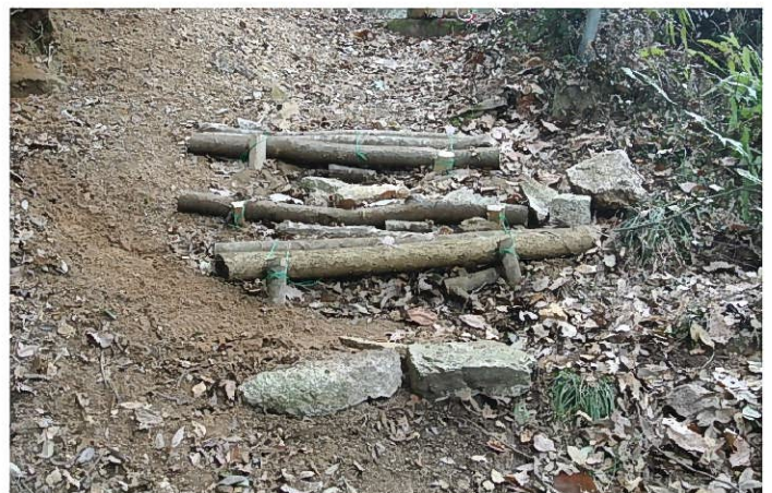
現地調達材で階段を補強