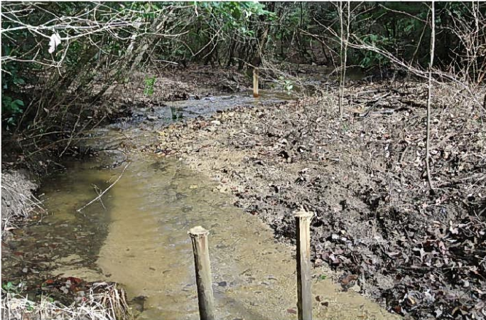
流木止めに杭を3本打つ