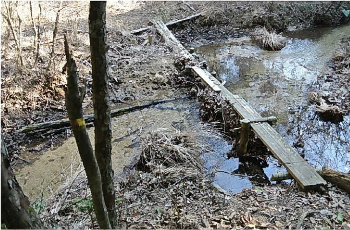
当会が素人細工で製作、架設を行った橋にも流木が一杯