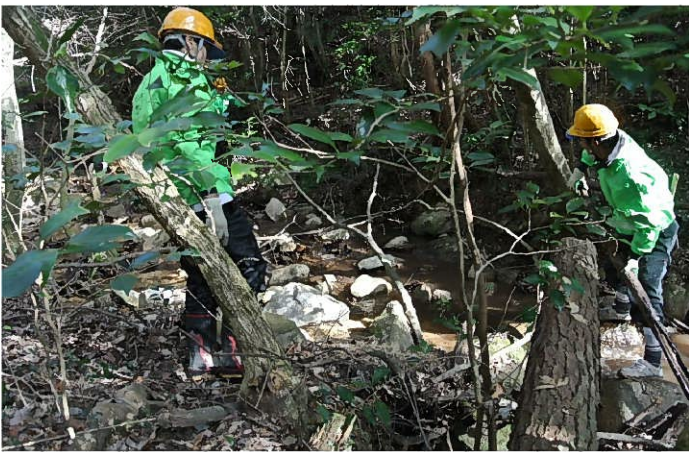
川の中に入って流木を処理中