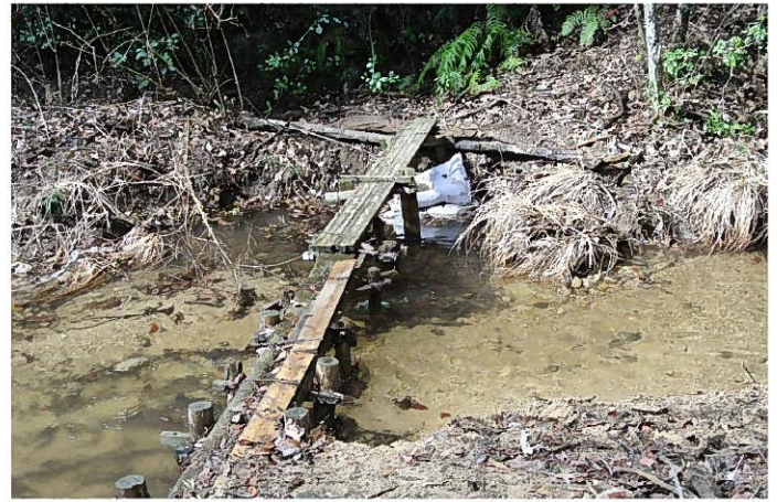
対岸に土俵3袋、鉄杭を打って固定する