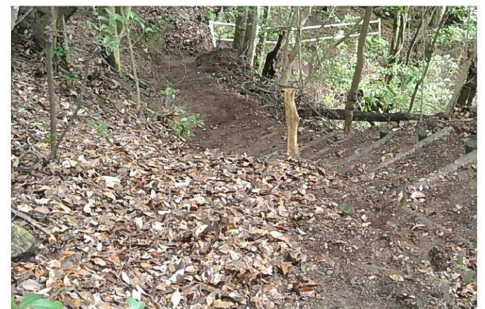
落葉、土砂、枝木を除去 清掃後