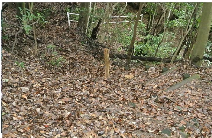
見事なほど分厚く積もった滝壺上の落ち葉等(手入れ前)