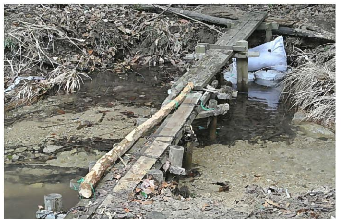
腐食した箇所を現場近傍の不要材を探して補強