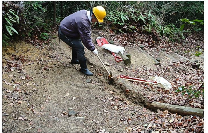
水路を掘っているところ