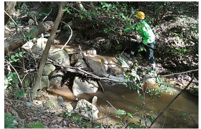
護岸を壊す流木を撤去中