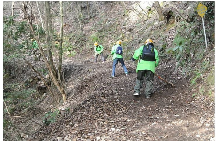
深山の滝 滝壺上の歩道に堆積した落ち葉、土砂を清掃中