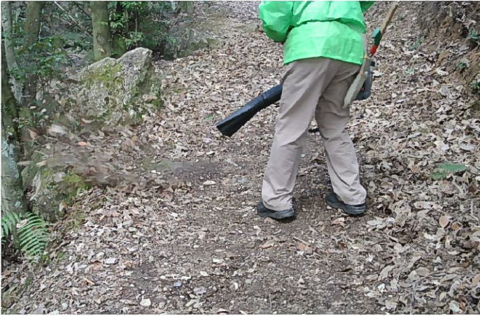
ハンドブロワーで落葉を吹き飛ばす