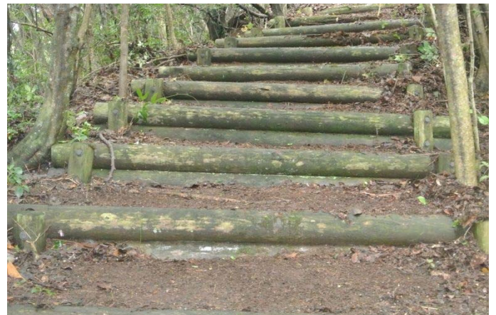
歩きにくかった階段もきれいに清掃後