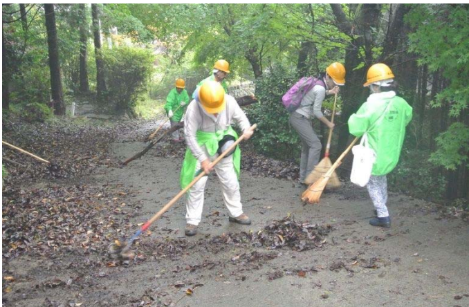
山頂の駐車場下 道路の落ち葉を時間待ち中に撤去中 霧がかかり視界よろしからず