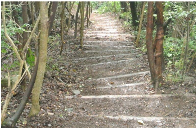
明るくなった登山路 整備後