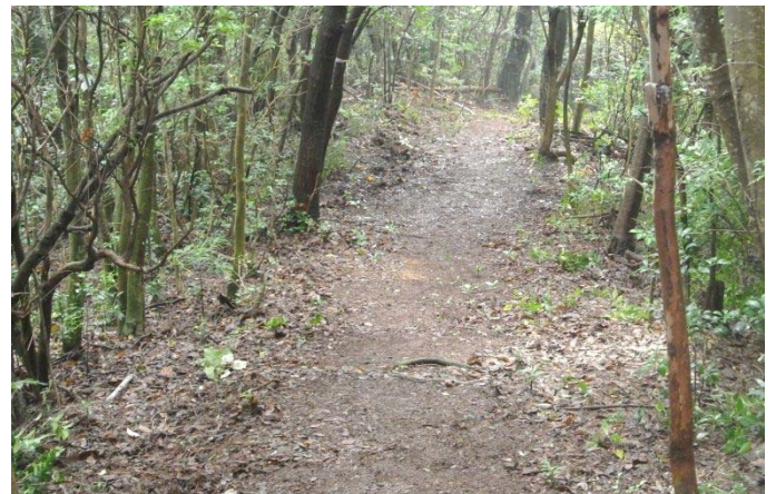
倒木 枯れ木 落ち葉を撤去後 大入方面へ