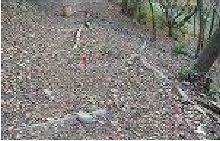
整備前の灰ヶ峰 正面登山路