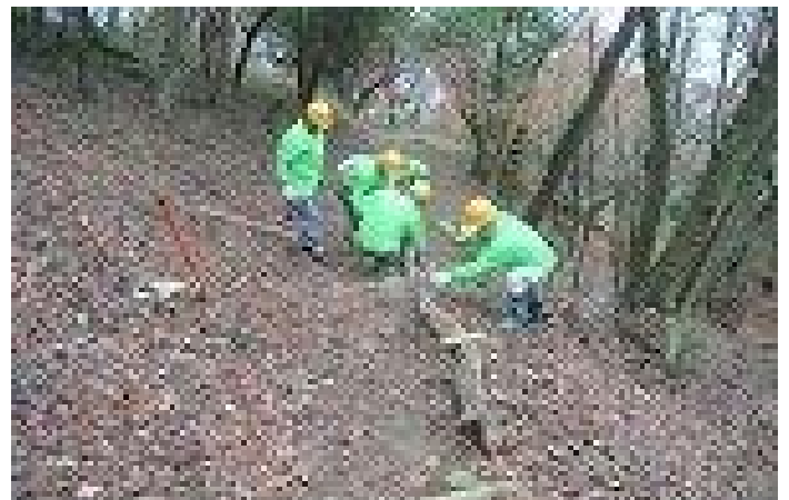
谷から引き上げた古木を路肩に活用するための作業中