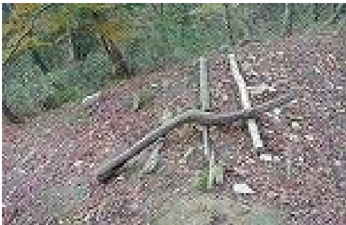
正面登山路 段差のある路の整備前