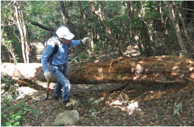
休山 宮原より登山路の倒木 三人で谷へ移動させた