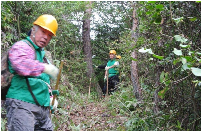
路を塞いだ杉の木を切断後