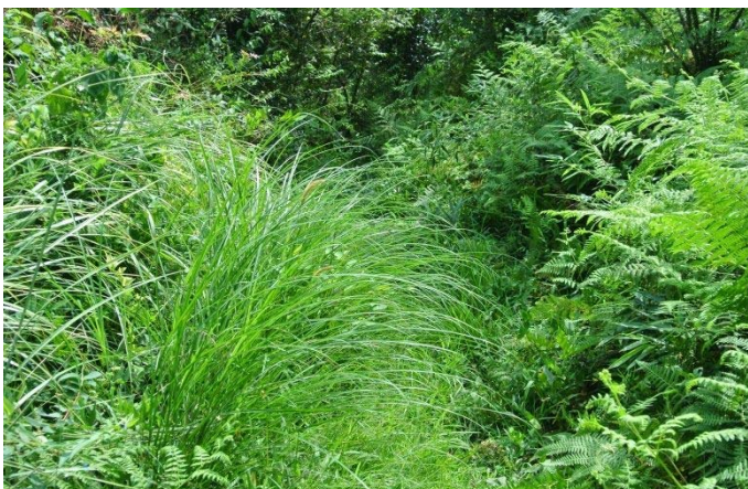
烏帽子岩山ルート 『湾岸ルート』草刈前