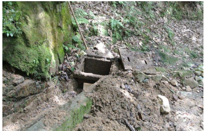
榎の土砂を撤去 9/10 土管に流れて路を削らない