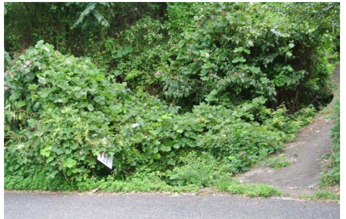
灰ヶ峰 妙泉寺のした下〔近道