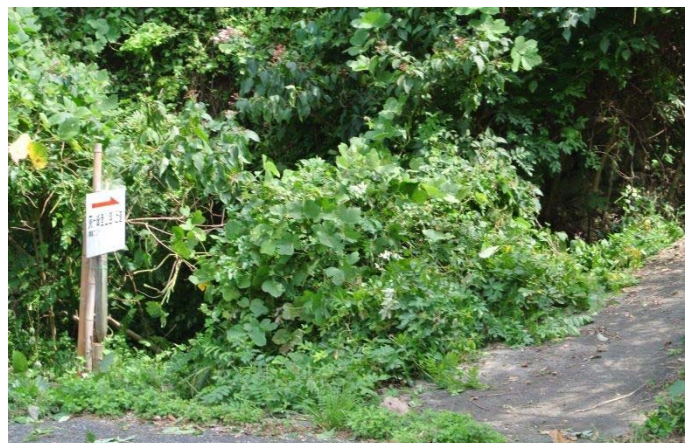
葛 を切って支柱を持参し番線で固定