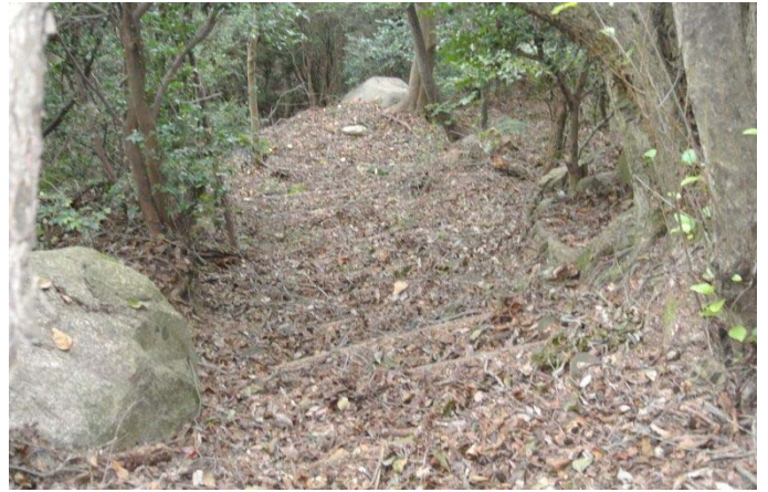
休山 大入側 整備前