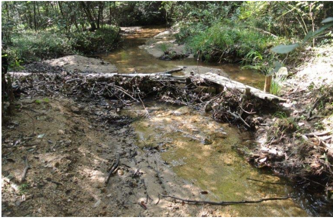
手作り橋 大屋川 巻きついたゴミ枯れ木 手入れ前