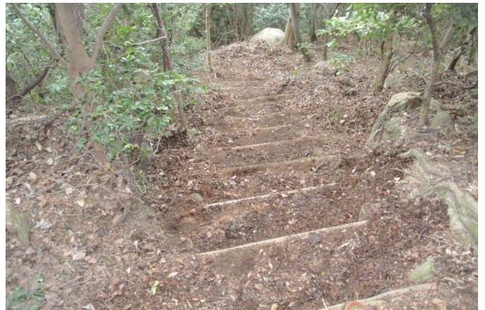
休山 大入側 整備後