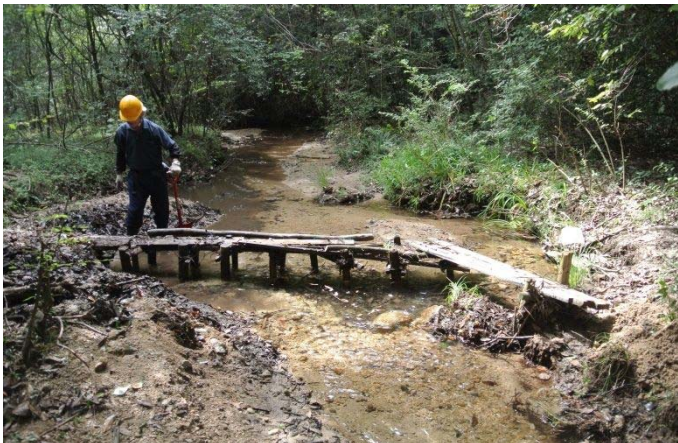
橋のゴミを取り除き 川底を掘り下げた 整備後 9/10