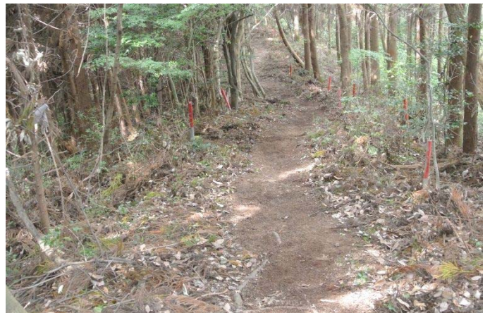
休山 大入側 整備後