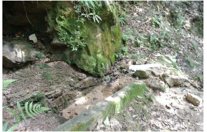
深山の滝の手前 谷からの土砂で榎が満杯 路に水が流れ路を削