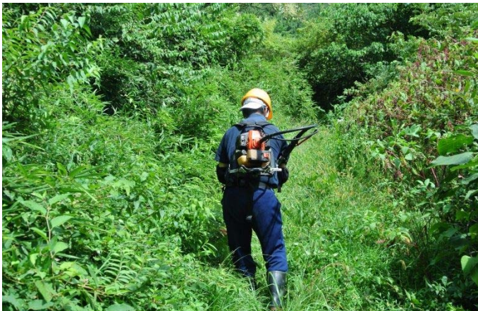
烏帽子岩山ルート 二艘木草刈中 9/13 宇吹氏