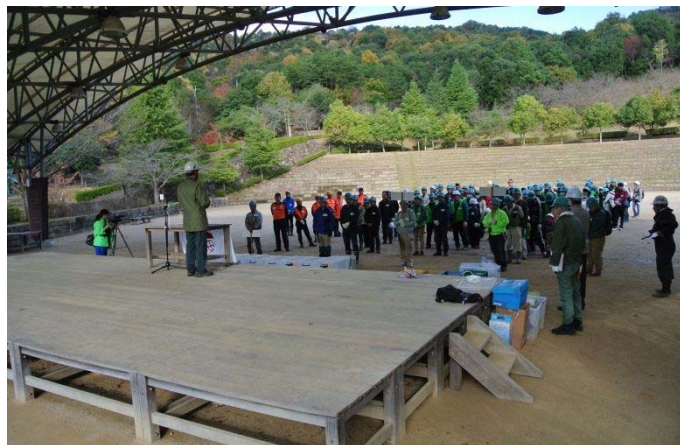
東広島市竜王山 グランドワークの開会式