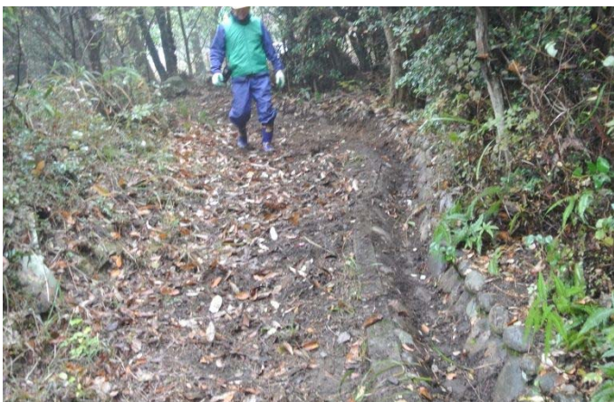
埋もれていた側溝を掘り出した