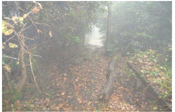
手入れ前の遊歩道 11/18