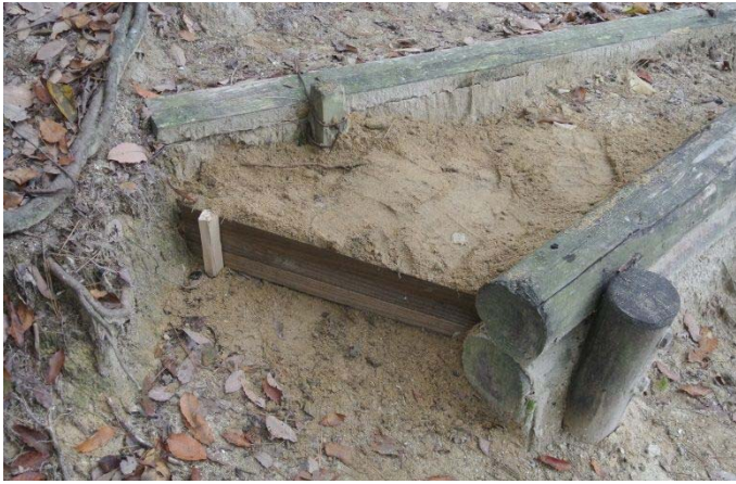
中国自然歩道「大庭山」廃材を使って階段の補修 11/22