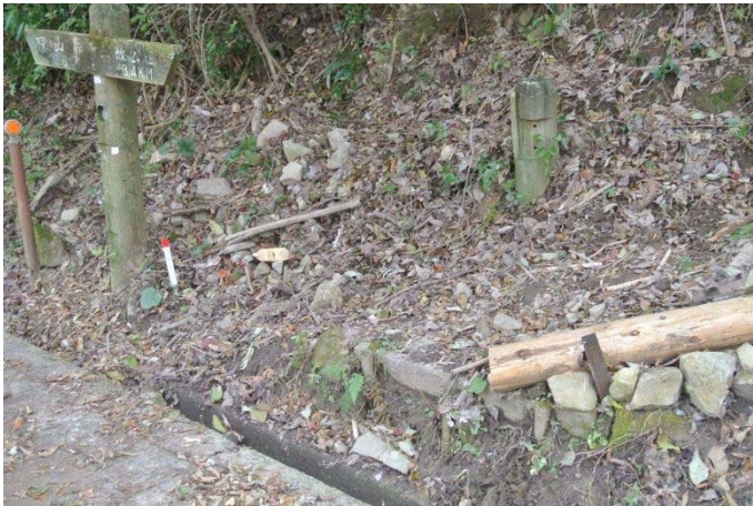
灰ヶ峰 道路からの進入口 整備前