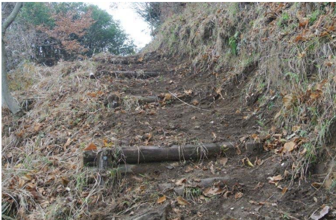
登山路の凸凹を根気よく均した 自然歩道 11/30