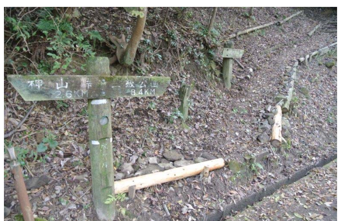
道路からの登る入口 整備後 (野呂山からの檜を使用)