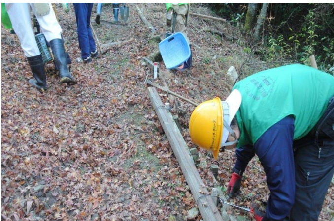
四角い廃材 番線を使って路肩を固定中