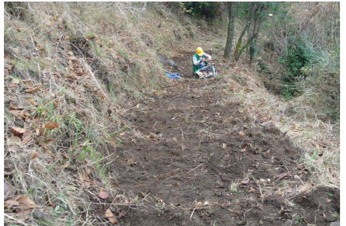
自然歩道 灰ヶ峰 路肩を猪が破壊したので補修後