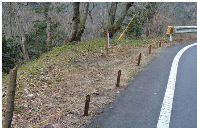
崖下にゴミの投棄をされる箇所 杭とロープで自衛策