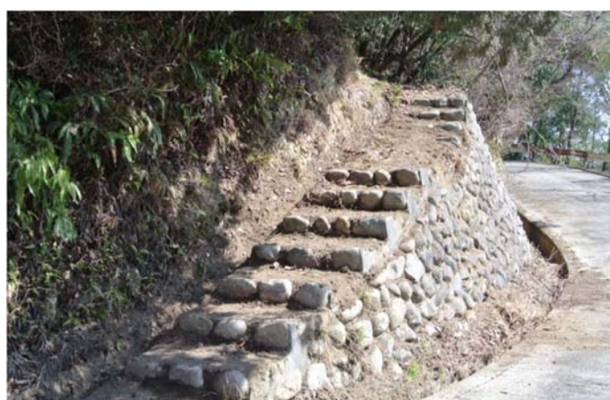
山頂に通じる遊歩道 見違えるようにきれいになった