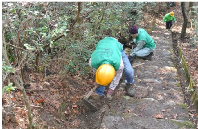
古くから放置されていた側溝 土砂 木の根を撤去中