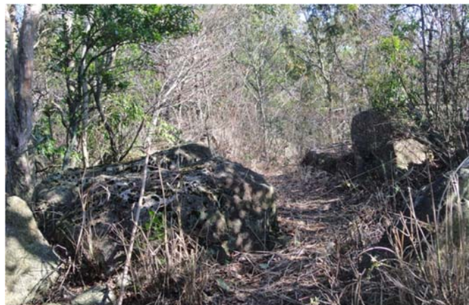
草刈後 広い広場のあるWCから高天原神社へ