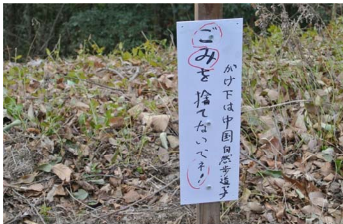
崖下にいつもゴミの投棄あり、トラロープを張る