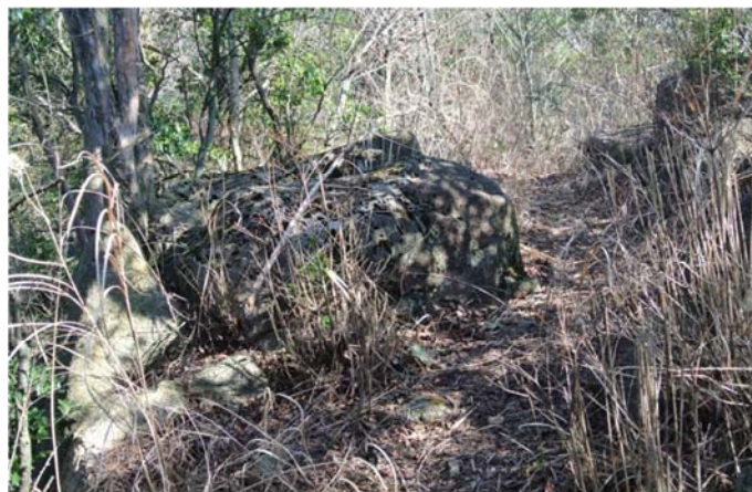
ナイロンロープで草刈り前