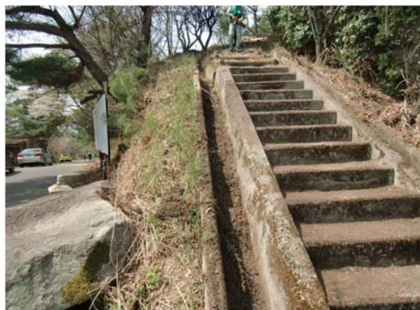
側溝の長年の土砂・石・ごみを掘り出し 清掃後