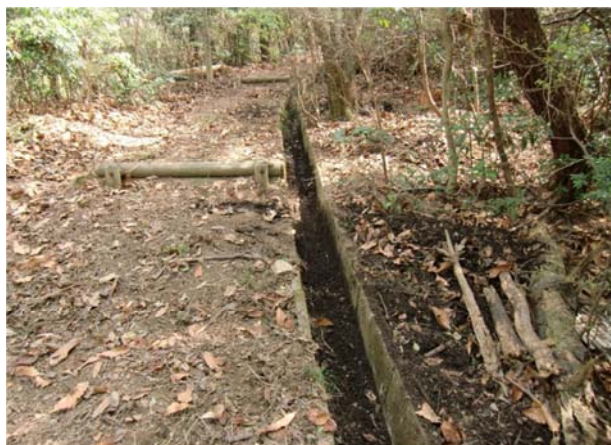
側溝の昔のゴミを撤去後