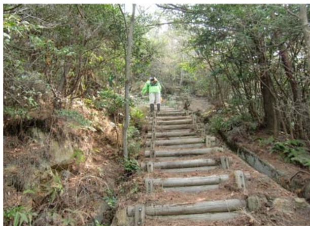
階段に分厚く積もった落ち葉 撤去後