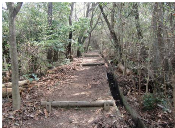
側溝にゴミで埋まっていたので清掃後