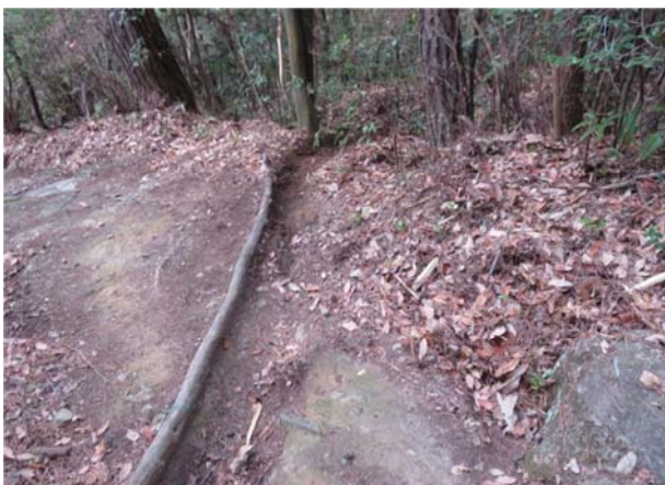
ブロアで落ち葉を撤去した横断溝