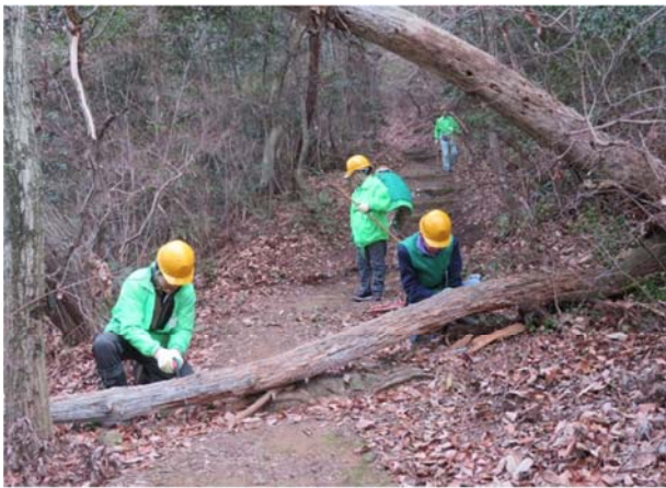
倒木切断中 自然歩道の倒木