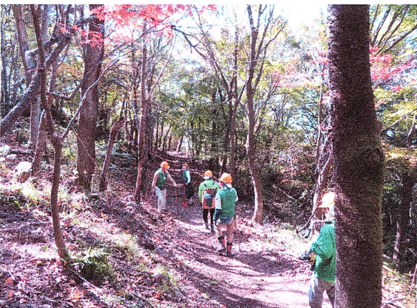
作業を終えて正面登山路退却中