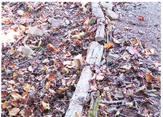
路肩の弱いところに木製の杭を打ちつけ番線で固定