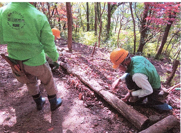
路肩 番線を使って締め付けている所