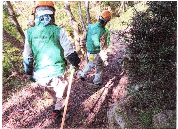
路肩の補強作業中