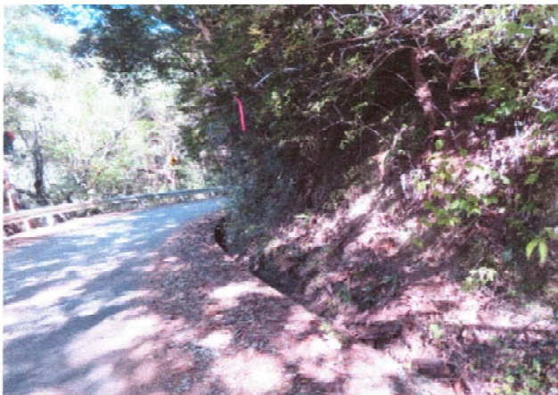
松枯れ 切断撤去後