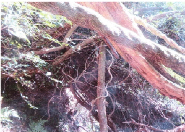
自然歩道 陥没して通行不可