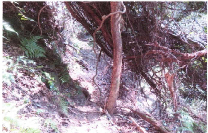
自然歩道 陥没のため通行不能