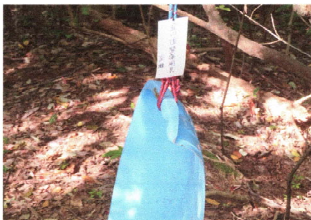
何時も一人で整備される Y氏がぶら下げた道具