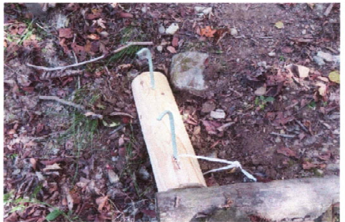
防腐剤入りの丸太を半分に 穴をあけ杭を打ち込む前