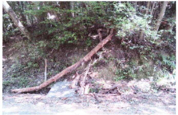
登山道路の松枯れ放置 通行にも当たりそう