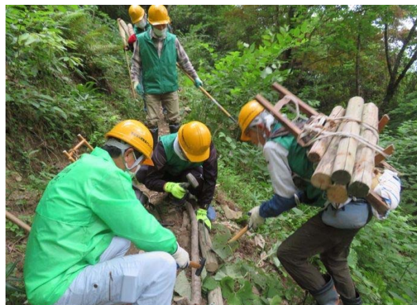
古い丸太を路肩に設置中 おいこの丸太回収分