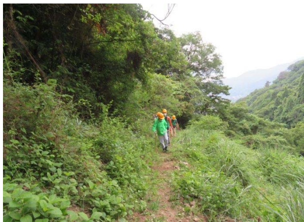
整備後退却中の灰ヶ峰登山路