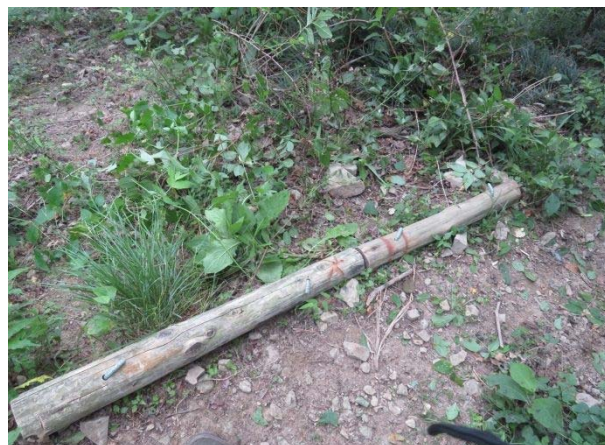
ウン十年経過した古い丸太を路肩に活用