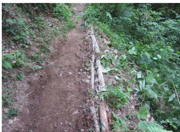
古い丸太を路肩に取付け後