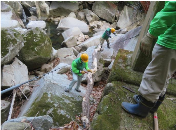
吊り橋のワイヤーにかかった枯木撤去中