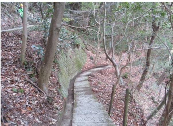
観音堂の参道 清掃後