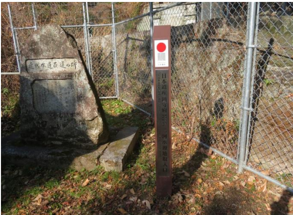
日本遺産鎮ジ府 二河水源地入口