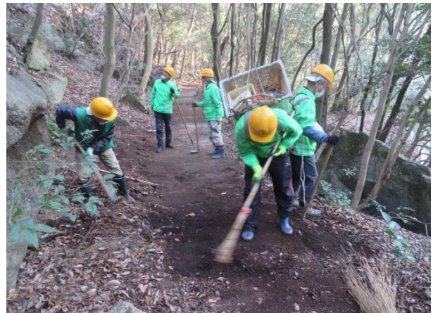
吊り橋の手前を清掃中