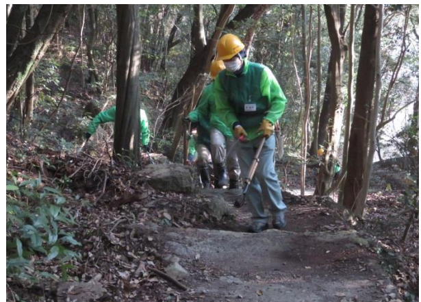
寒くとも頑張る参加者