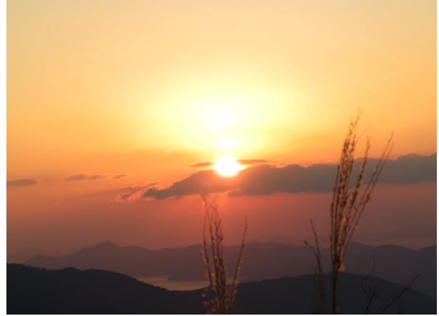
標高737m 灰ヶ峰山頂にて 1/1 7時8分