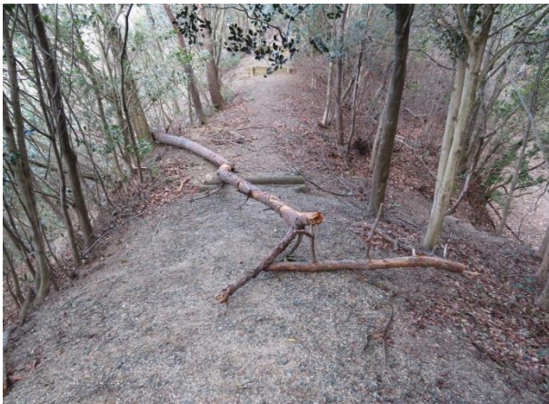
登山路に倒れた倒木