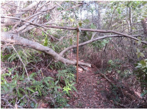
倒れた木が登山路を塞いでいた