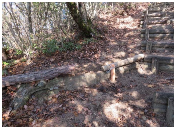
廃材丸太を使って水路の補修