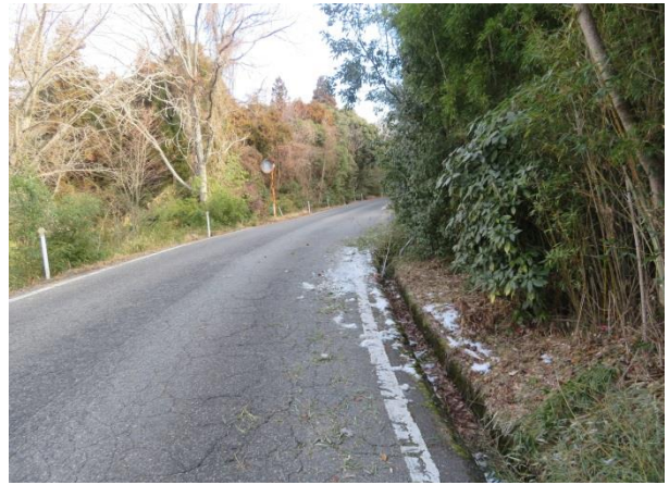
倒れた竹を撤去後