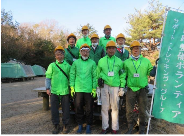
野外活動センターにて