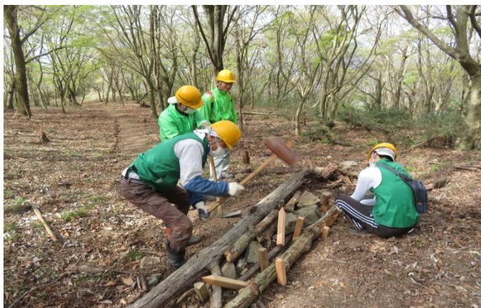
枯れてしまった古い木をかついで横断溝に活用