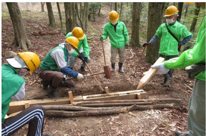
山頂付近から雨水を食い止める横断溝作成中