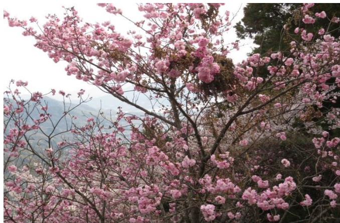
八重桜 登山道路から撮影