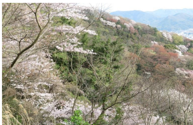
登山道路から 桜を一望