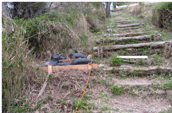
40年前の階段壊れて段差が大きすぎるので土嚢で補修