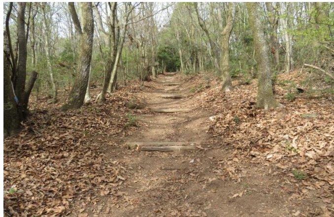
坂道の登山路、落ち葉清掃後 女性の活躍が光る