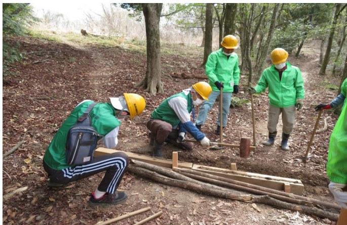
横断溝新規作成中