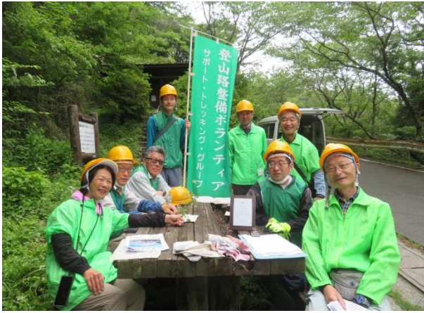
登山道路第二番目の展望台にて