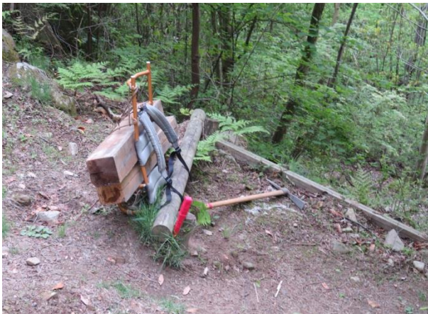
角材をオイコで運搬中