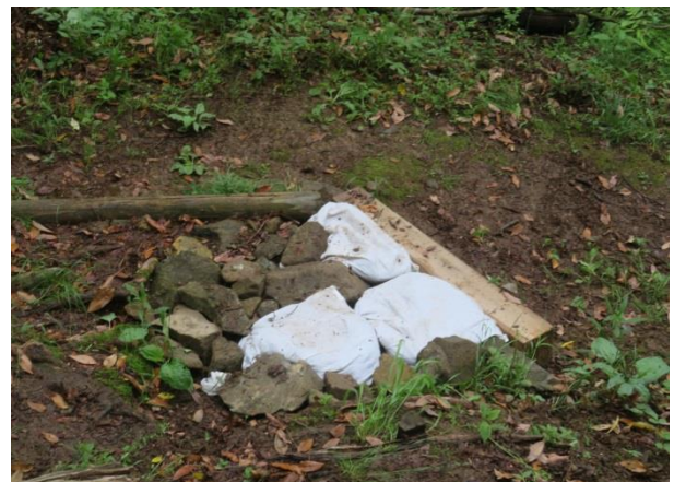
窪んだ階段に土嚢を活用