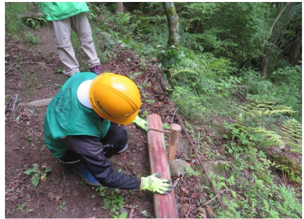
路肩に丸太をすえて木の杭で固定