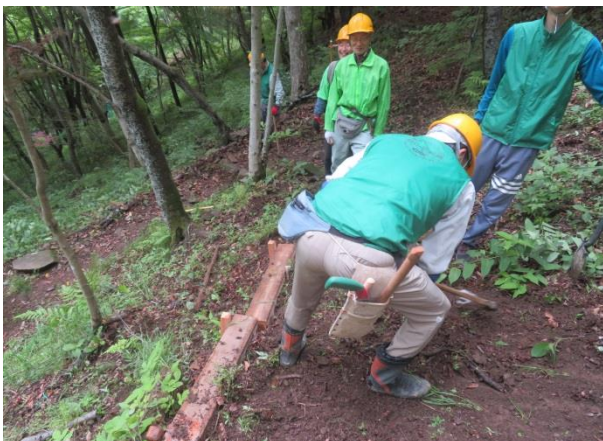
路肩に丸太を杭で固定中