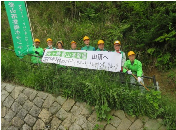
第二展望台からの登山口にて 8名