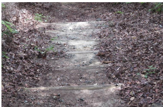
ブロアで階段の落ち葉を飛ばす