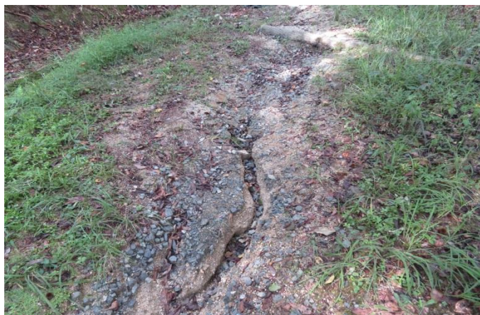
側溝に流れる水が道路を削り取る 30年前にも