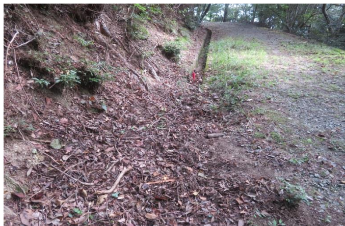
詰まってしまった側溝 手入れ前