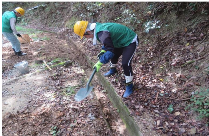
潰れていた側溝 堀戻し中