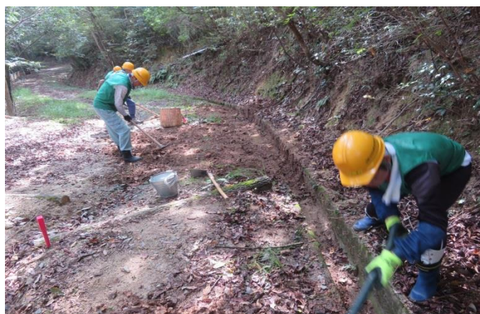
土木工事さながらのボランティア活動