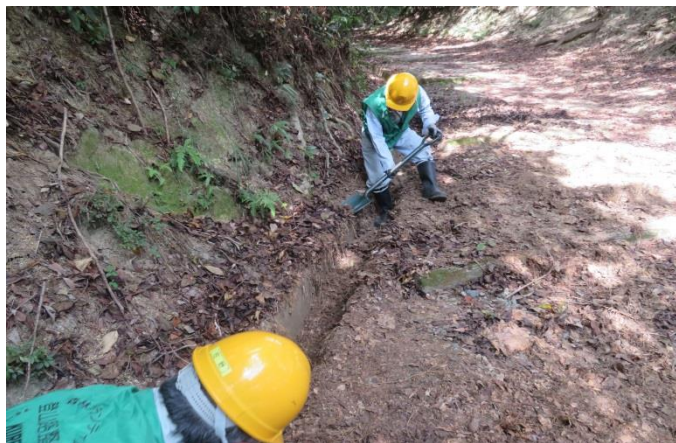
側溝に足を入れて、土木工事？