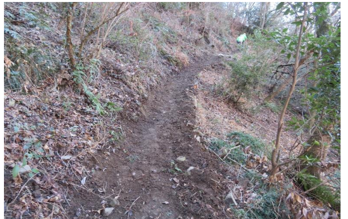
路を広げ斜めを水平に 七曲りコース