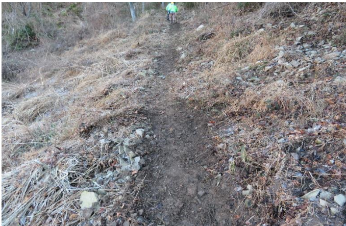
滑りやすい石ころを撤去して幅を広げた