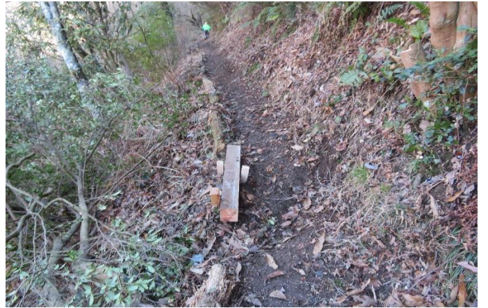
路肩の補強に持参の角材 杭で止めた