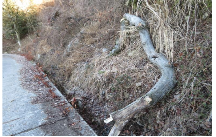
倒木処理前 山頂への道路にて