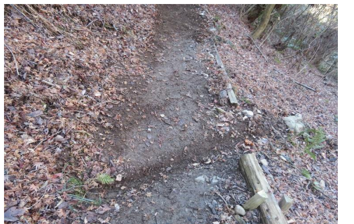
横断溝の掘り下げ後