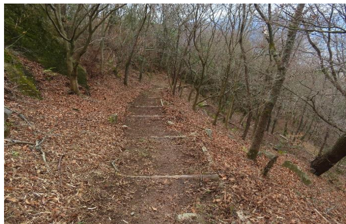
ブローアの活用できれいになった登山路