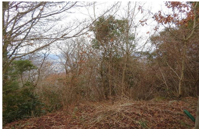
9合目東屋からの眺望が悪い