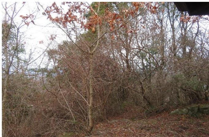
9合目東屋周辺の雑木林。眺望悪し