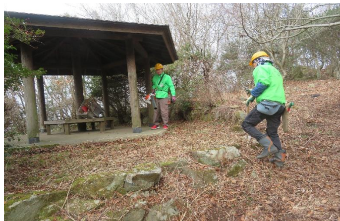
9合目の東屋と周りの雑木林