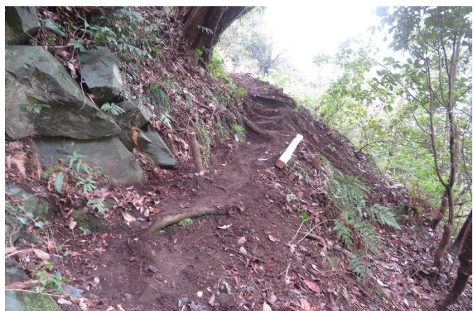
大木で狭くなった登山路を拡幅、階段掘り込み