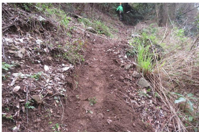
金名水進入路の拡幅