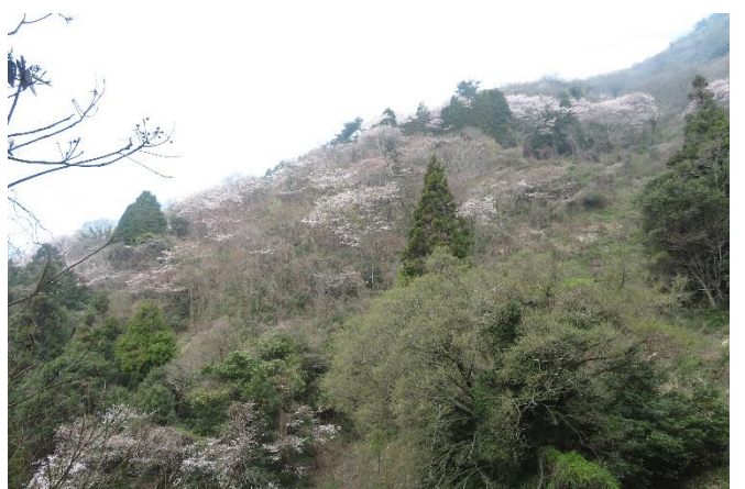
灰ヶ峰の満開の桜