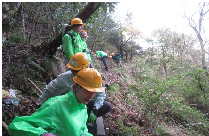
金名水の進入路の整備状況