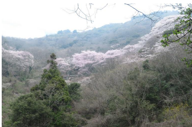
灰ヶ峰の満開の桜を見上げる