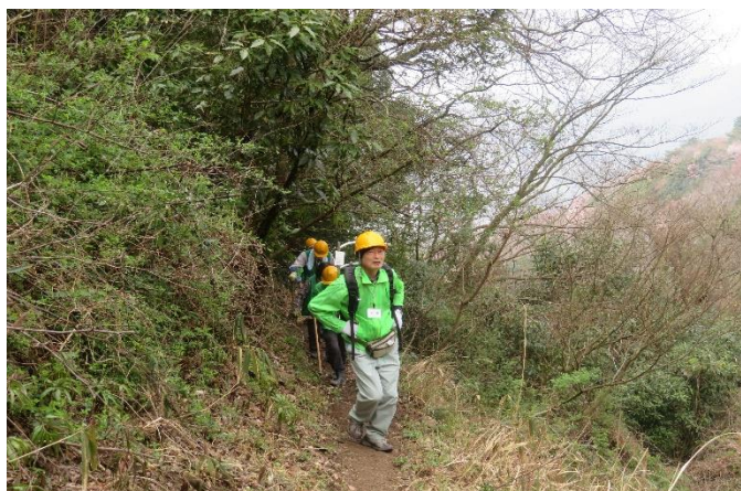
整備後に空になった背負子を背負って撒収状況。