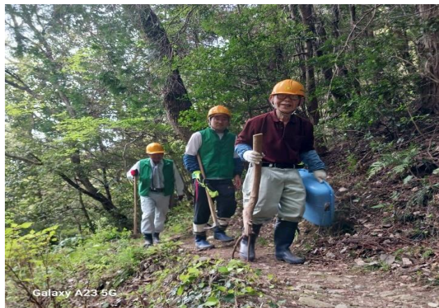
銀名水への進入路を整備