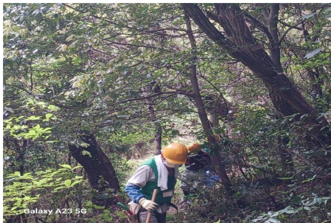
銀名水進入路の整備中