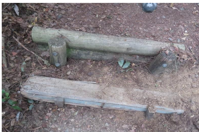
階段の段差が大きいところへ角材を設置①