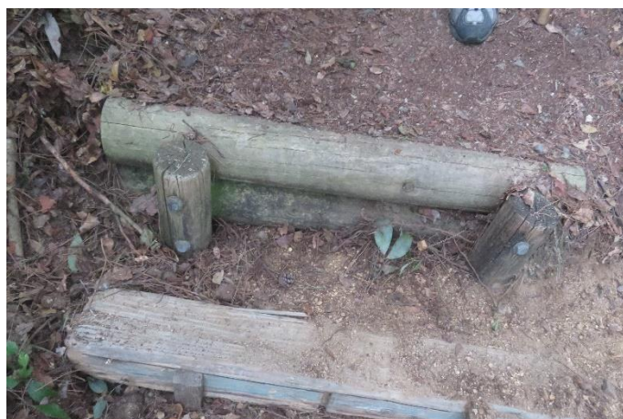
階段の足を乗せる部分を広げるために角材を設置②