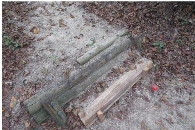
階段の段差が大きいところへ角材を設置②