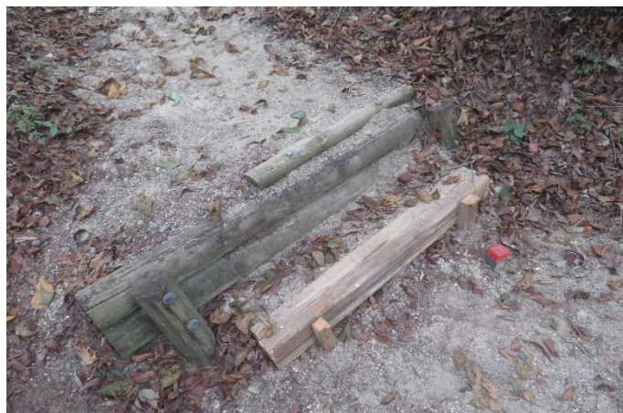
段差の大きい階段