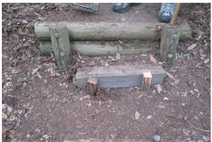
階段の足を乗せる部分を広げるために角材を設置①