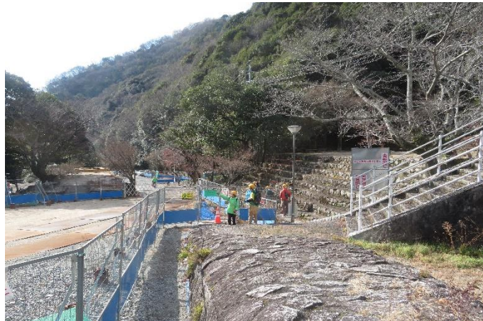
帰り道の一コマ。今年も頑張っていきましょう！