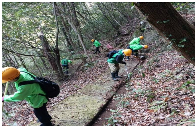
作業の様子① 側溝から泥や落ち葉を道へ掻き出し、それらを熊手で道の外へ掃いていきます。