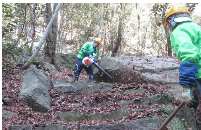
作業の様子③ ブロワーも大活躍でした。