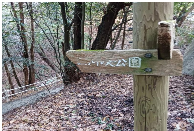
今回の例会場所である二河峡公園。 当会の活動は毎年ここから始まります。