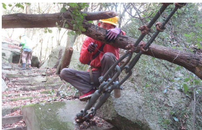
作業の様子② 手鋸で木を切る場面もありました。