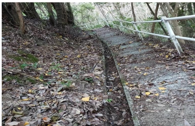
整備前の参道。 昨年の落ち葉がそのまま残っています。