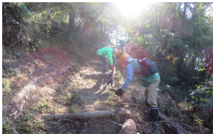
作業の様子④。寒くなってきましたが、日差しが強いとまだ暑さを感じるかもしれません。