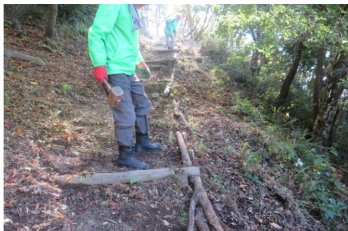
作業後の登山路。皆さん作業お疲れさまでした。