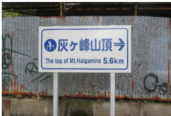
市が新しく設置した看板でしょうか。