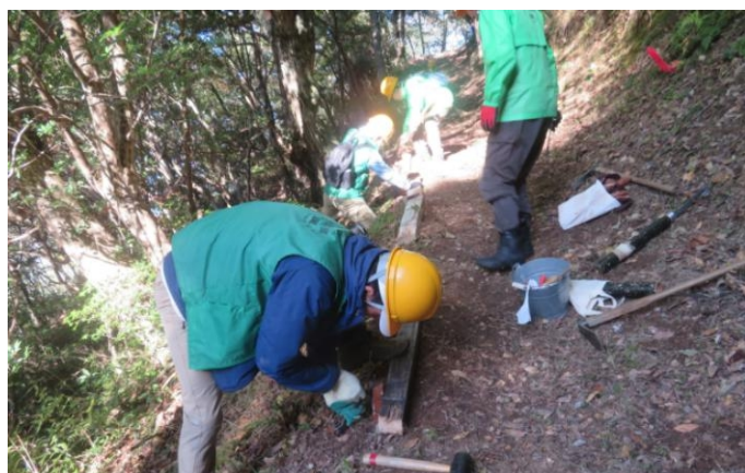
作業の様子②。皆で角材を設置しています。