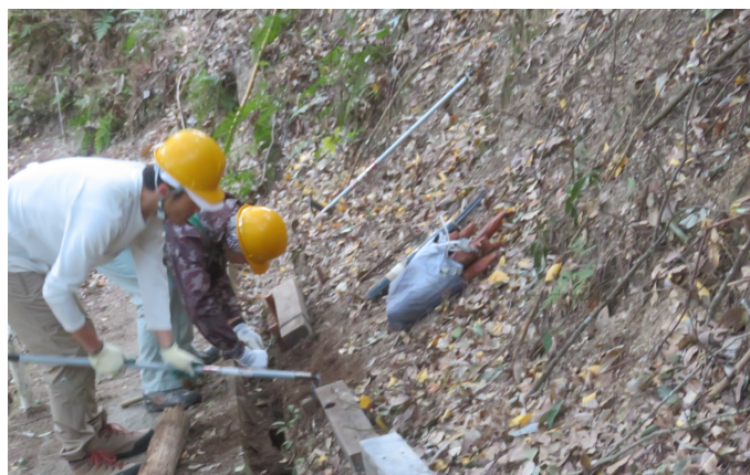
作業の様子③。路肩に角材を設置するために