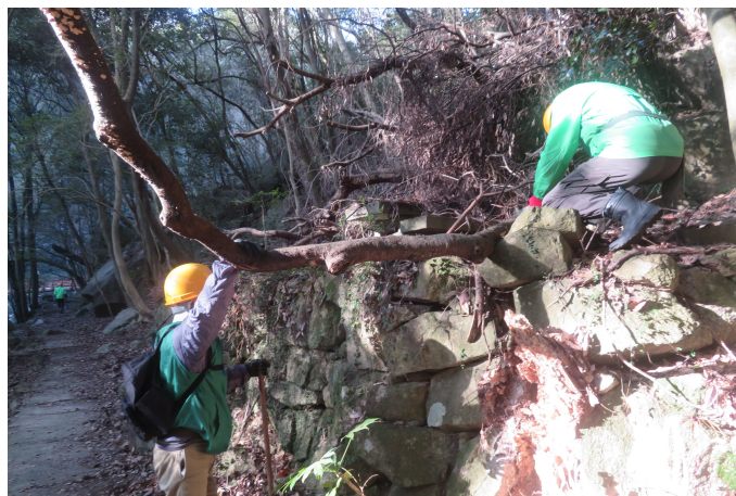
作業の様子①。道に飛び出た木を手鋸で伐(き)っています。