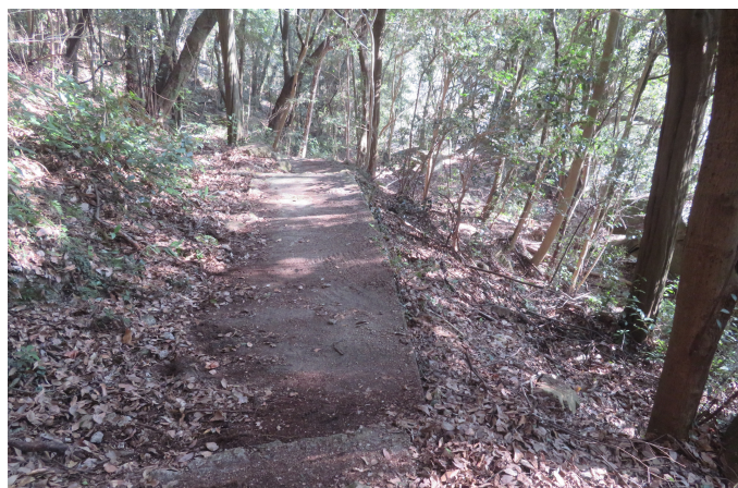
作業後の登山道③。皆さん作業お疲れさまでした。