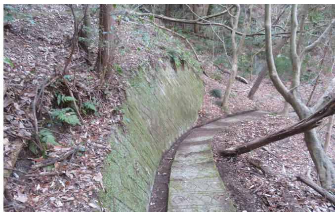
作業後の登山道①。落ち葉と土砂で完全に埋まっていた側溝がはっきりと視認出来るレベルまで復旧しました。