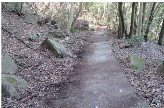
作業後の登山道②。作業前はどこまでが道なのか分からない有様でした。