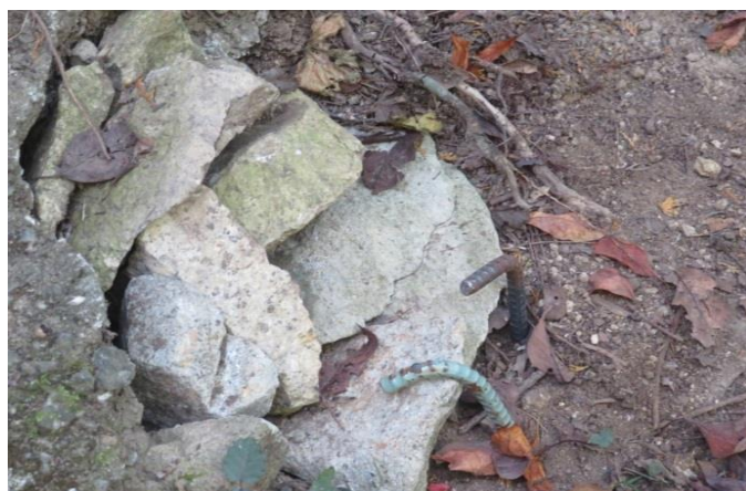
石段の石が一つ抜けてしまったので補修