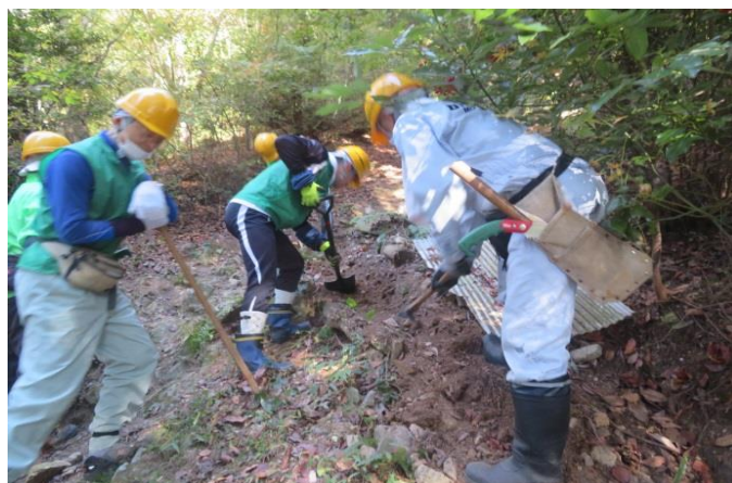
横断溝を作製して掘り下げ中