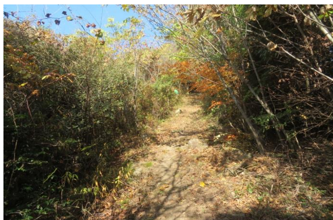
草刈り後の登山路