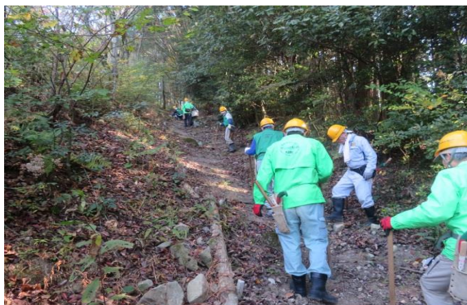
滑りやすい登山路 小石などを撤去中