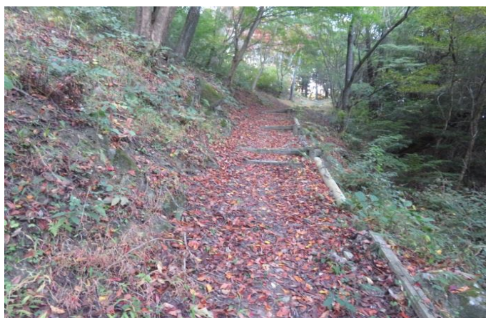
落葉を撤去前の登山路